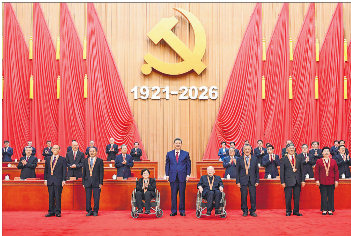
7月1日上午,庆祝中国共产党成立105周年大会在北京人民大会堂隆重举行。中共中央总书记、国家主席、中央军委主席习近平向“七一勋章”获得者颁授勋章。

新华社北京7月1日电 庆祝中国共产党成立105周年大会7月1日上午在北京人民大会堂隆重举行。中共中央总书记、国家主席、中央军委主席习近平向“七一勋章”获得者颁授勋章并发表重要讲话。他强调,105年来,我们党始终坚守为中国人民谋幸福、为中华民族谋复兴的初心使命,在不懈奋斗中创造了彪炳史册的伟大成就。新征程上,全党同志要坚定信心、接续奋斗,不断创造无愧于时代和人民的新业绩。