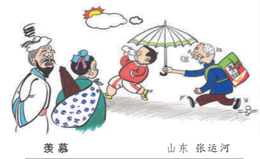
静谧的课堂 广东 苏永胜