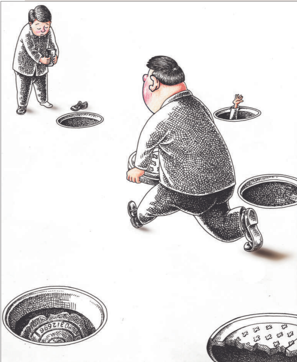
被曝光了的问题才是问题