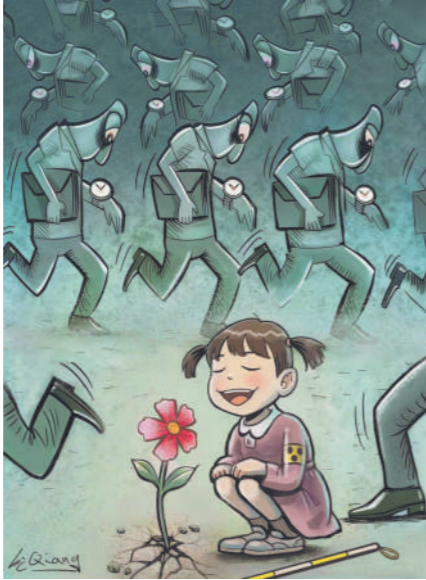
花香 河北 刘强