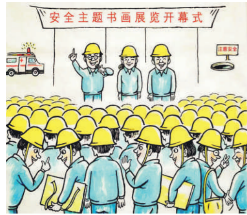
安全意识 四川 高翔