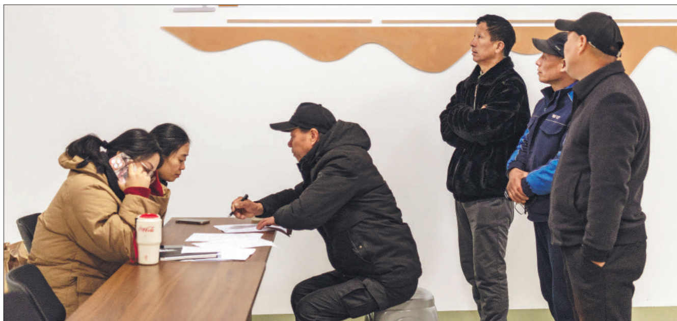
2025年2月14日,浙江省金华市婺城区零工市场,求职者在排队应聘。