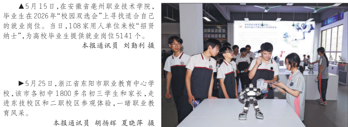
▲5月25日,浙江省东阳市职业教育中心学校,该市各初中1800多名初三学生和家,走进东技校区和二职校区参观体验,一睹职业教育风采。