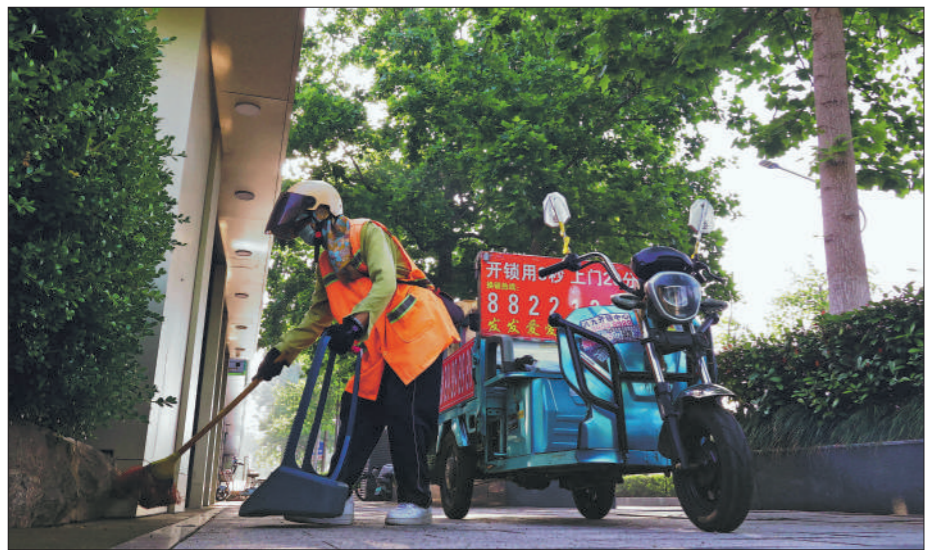
▲5月28日,江苏省连云港市海州区苍梧路,57岁的环卫工人林国莲正在保洁作业。