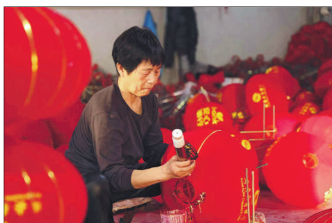
2024年12月17日,河北省石家庄市藁城区梅花镇屯头村一家官灯厂内,一位超龄劳动者正在制作官灯。

5月25日,人力资源和社会保障部等5部门对外发布《超龄劳动者基本权益保障暂行规定》,自7月1日起施行。作为国内首部专门针对超龄劳动者权益保障的规章,它填补了现有劳动保障体系的空白,对劳动报酬、休息休假、劳动安全卫生、工伤保障等核心权益作出明确规范,以法治护航奔波谋生的超龄劳动者。