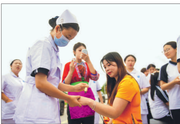
5月21日,在贵州省从江县职业技术学校,护理专业学生为师生提供艾灸康养服务。

近年来,职业教育热度持续攀升,多地招生现场出现数百人竞争少量名额的火热场面。随着高等教育的普及和就业环境的变化,社会对人才的评判标准更加包容。畅通的升学就业渠道,让职校学子拥有了更广阔的发展空间,学习一技之长成为不少家庭的务实选择。正视职业教育的独特价值,尊重每个人的特长与发展路径,正成为社会共识。