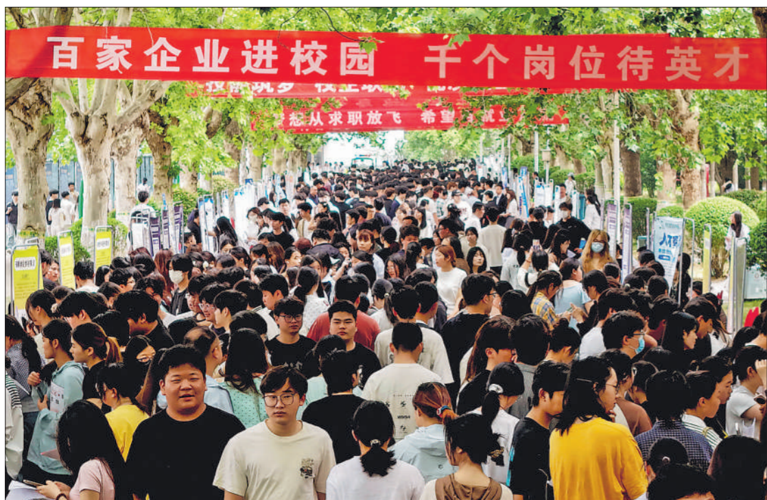
▲5月15日,在安徽省亳州职业技术学院,毕业生在2026年“校园双选会”上寻找适合自己的就业岗位。当日,108家用人单位来校“招贤纳士”,为高校毕业生提供就业岗位5141个。