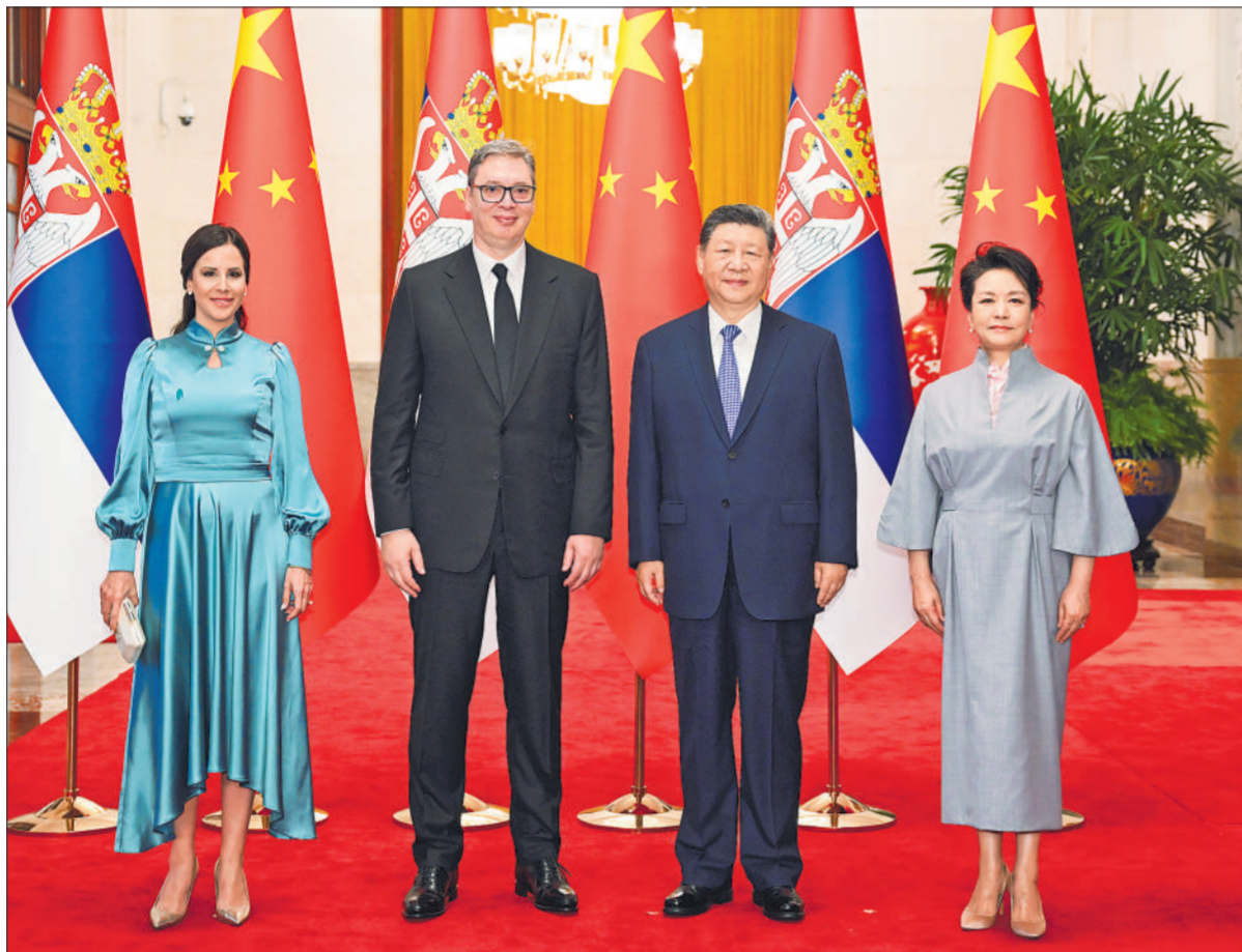
5月25日下午,国家主席习近平在北京人民大会堂同来华进行国事访问的塞尔维亚总统武契奇举行会谈。这是会谈前,习近平和夫人彭丽媛同武契奇和夫人塔玛拉合影。