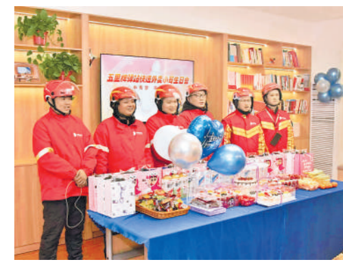
2026年1月16日,长沙市芙蓉区五星牌驿站为辖区1月份出生的新就业形态劳动者举办“新”集体生日会。该驿站每月15日固定开展“快递外卖小哥生日快闪月”活动,持续增强新就业群体的归属感和幸福感。

湖南工会以工人文化宫、职工书屋为主阵地,将“送文化”与“种文化”相结合。2018年以来,湖南工人文化宫共开展文艺演出、文艺培训、美术摄影展、红色观影、送文化下基层等各类文化活动8.3万余场,服务职工群众2200万人次,年均达300万人次,切实打造新时代职工的学校和乐园。