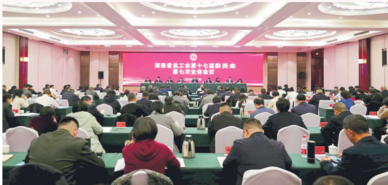
2026年3月17日,湖南省总工会第十七届委员会第七次全体会议在长沙召开。

2026年3月17日,“思想铸魂·湘工答卷”——中国工人大思政课·湖南篇第三季成果展示活动举行。舞台上,情景剧思政课《钢轨上的灯塔》生动展现了广铁集团怀化工务段娄底工人理论小组38年的思政传承。