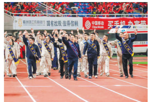
2025年10月25日,湘起联赛株洲赛区主场日恰逢第二个“株洲工匠日”。当天,株洲国、省、市三级劳模工匠方阵走上绿茵场巡游,上演了“体育+工匠”深度融合的耀眼一幕。

总书记指出,“工人阶级和广大劳动群众在长期奋斗中铸就的劳模精神、劳动精神、工匠精神,是社会主义核心价值观的生动体现”“劳动模范和先进工作者是人民的楷模、国家的栋梁”。