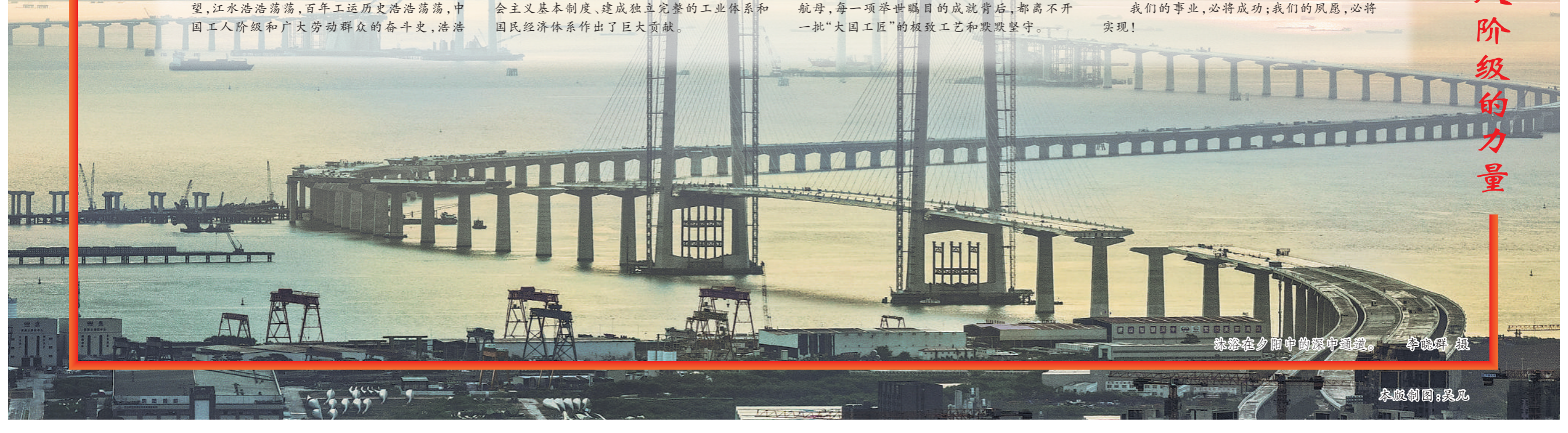
铁路在夕阳中的深中通道。