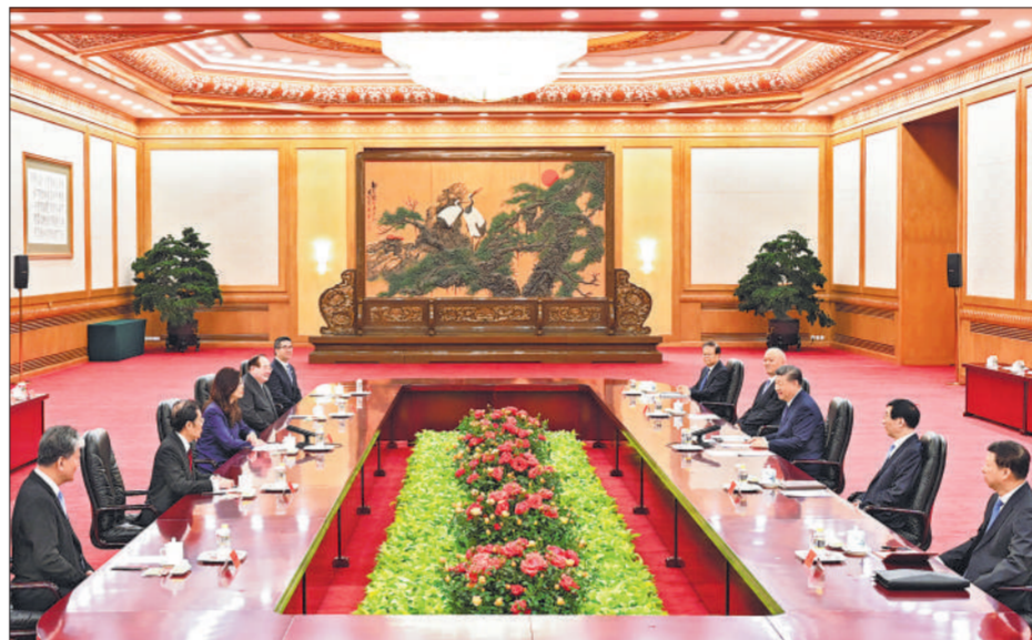
4月10日上午，中共中央总书记习近平在北京会见郑丽文主席率领的中国国民党访问团。