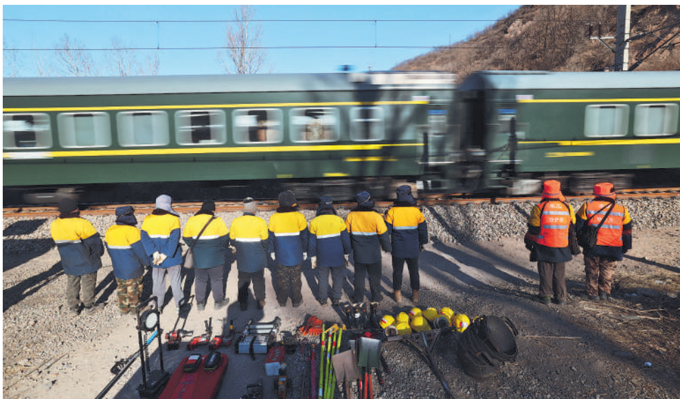
2月5日上午,即将在钢轨上作业的工人避让过往列车。