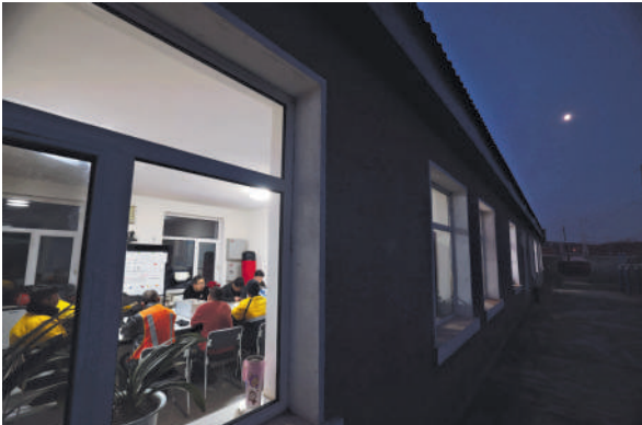
2月5日早晨6点50分,工人开早会布置当天工作。