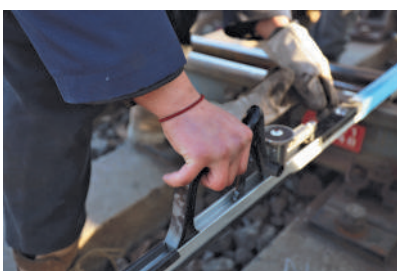
2月5日,极寒天气下室外作业,手被冻得通红。