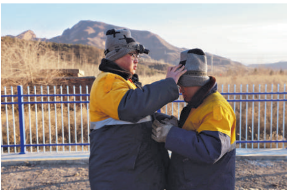
2月5日,工友间互相帮忙戴好头灯。