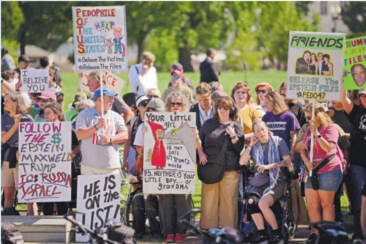
在美国华盛顿国会大厦外,抗议者声援爱泼斯坦案受害者。

根据法庭文件与媒体报道,从1999年开始,爱泼斯坦凭借雄厚财力,诱使青年或未成年女性来到岛上,为其本人或上岛的权