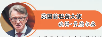
英国前驻美大使 彼得·曼德尔森

美国司法部公开的爱泼斯坦案剩余文件中,包含莱恰克2018年担任斯洛伐克外长期间与爱泼斯坦的通信记录,内容涉及年轻女性。