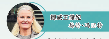
挪威王储妃 梅特·玛丽特

美国司法部公布的最新档案文件显示,爱泼斯坦曾在2003年至2004年间,分三次向曼德尔森支付共计7.5万美元。