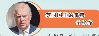
英国国王的弟弟 安德鲁

特朗普在爱泼斯坦案文件中被提及超过1000次。据报道,其中一些内容包括新近披露的、尚未核实的针对特朗普的性侵指控。