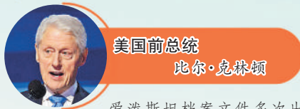
美国前总统 比尔·克林顿