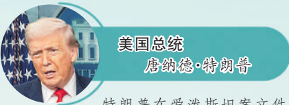
美国总统 唐纳德·特朗普

特朗普在爱泼斯坦案文件中被提及超过1000次。据报道,其中一些内容包括新近披露的、尚未核实的针对特朗普的性侵指控。