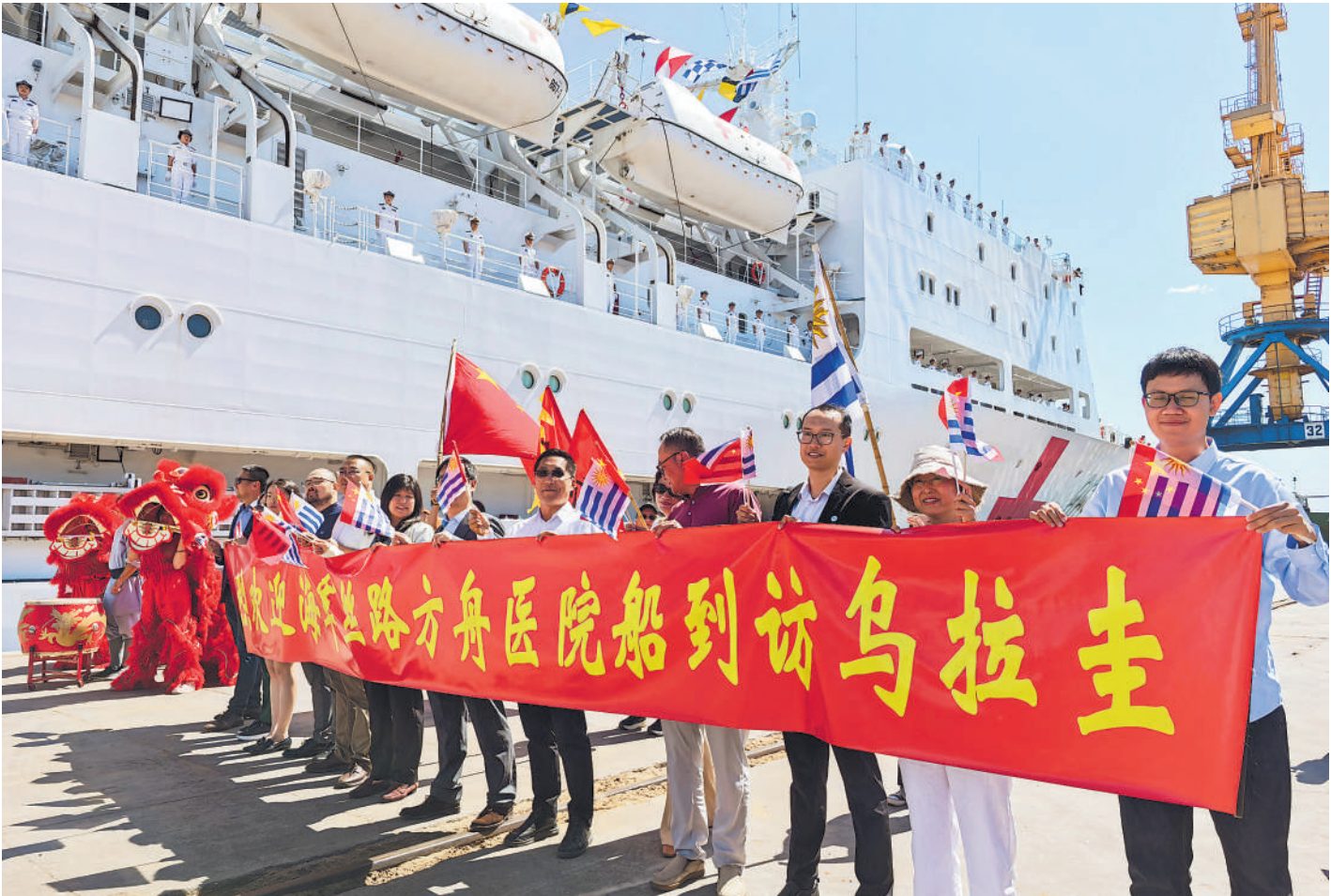
中国海军舰艇首次停靠乌拉圭

然而,令人遗憾与担忧的是,就在气候变化危机迫在眉睫之时,全球气候行动却面临诸多阻碍、乃至遭遇了巨大的政治倒退。一方面,联合国环境规划署此前发布的《2025年适应差距报告》提及,在应对气候变化方面,发展中国家适应气候的资金缺口正不断扩大;另一方面,美国政府不久前宣布退出包括联合国气候变化专门委员会在内的数十个国际实体,给全球气候多边协作前景蒙上阴影。