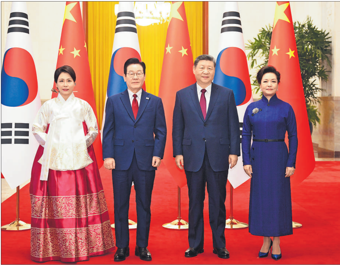
1月5日下午，国家主席习近平在北京人民大会堂同来华进行国事访问的韩国总统李在明举行会谈。这是会谈前，习近平和夫人彭丽媛同李在明和夫人金惠景合影。