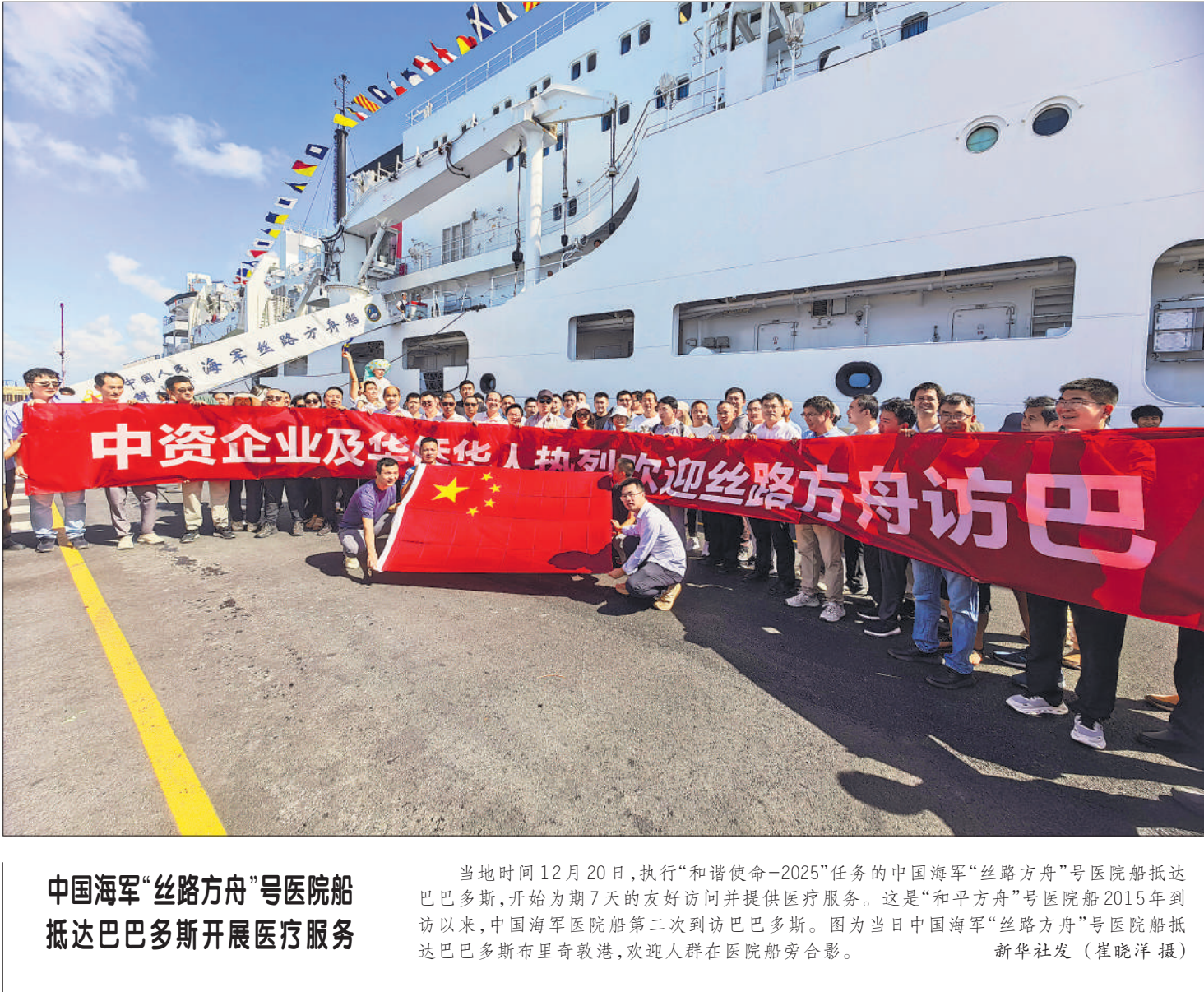
中国海军“丝路方舟”号医院船抵达巴巴多斯开展医疗服务

当地时间12月20日,执行“和谐使命-2025”任务的中国海军“丝路方舟”号医院船抵达巴巴多斯,开始为期7天的友好访问并提供医疗服务。这是“和平方舟”号医院船2015年到访以来,中国海军医院船第二次到访巴巴多斯。图为当日中国海军“丝路方舟”号医院船抵达巴巴多斯布里克敦港,欢迎人群在医院船旁合影。