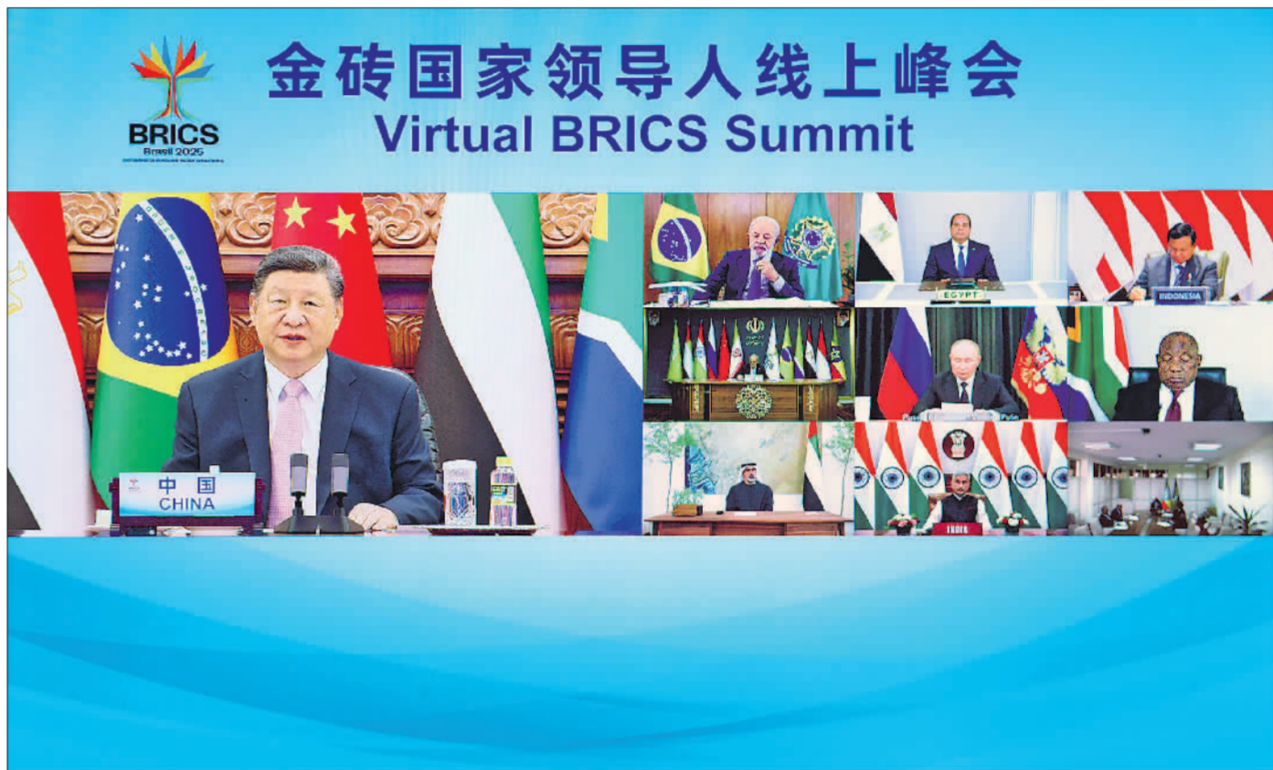
9月8日晚，国家主席习近平出席金砖国家领导人线上峰会，并发表题为《团结合作 砥砺前行》的重要讲话。