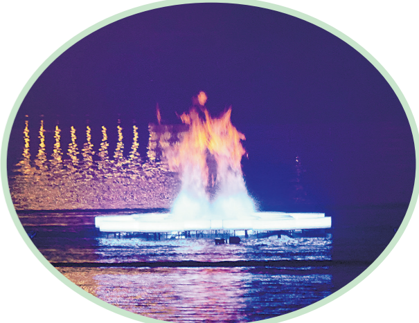
图为主火炬在开幕式现场被点燃。

从1928年阿姆斯特丹奥运会首次出现圣火传递,到1948年伦敦奥运会第一次通过电视进行直播;从1960年罗马奥运会首次由女选手宣读运动员誓言,到1984年洛杉矶奥运会众多科技元素惊艳亮相;从1992年巴塞罗那奥运会别出心裁的“射箭”点火仪式,到2008年北京奥运会上那场展现中国文化底蕴和民族自豪的全球视听盛宴……现代奥运会的开幕式一直在历久弥新,不断突破创意和想象空间。