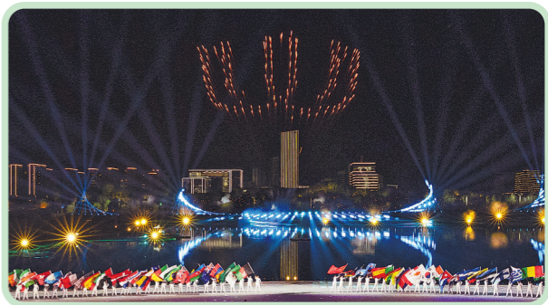
图为开幕式现场。