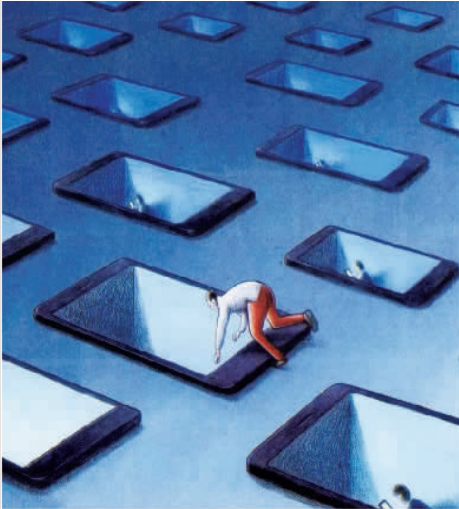
【奥地利】克劳斯皮特

旅行人问路,志愿者立马回答:“顺着抛弃的垃圾走……”余言未尽,似乎在提醒大家——保护人类共同的旅游胜地!