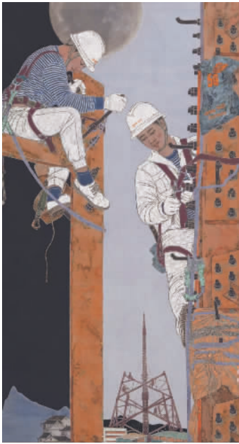
5G时代——和谐家园(国画)