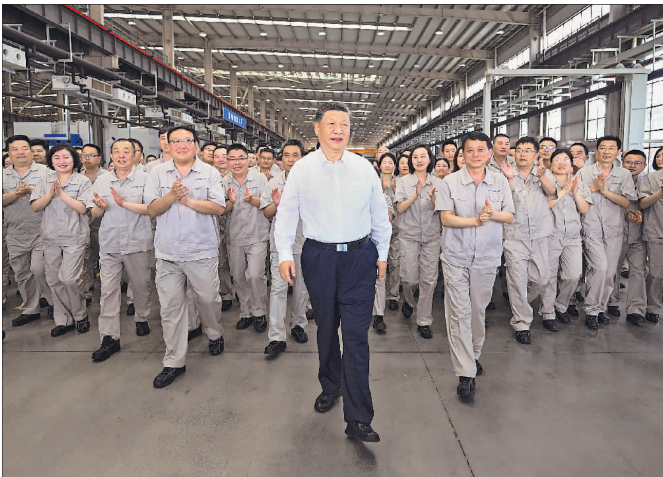
5月19日至20日，中共中央总书记、国家主席、中央军委主席习近平在河南考察。这是19日下午，习近平在洛阳轴承集团股份有限公司智能工厂考察时，同企业职工在一起。