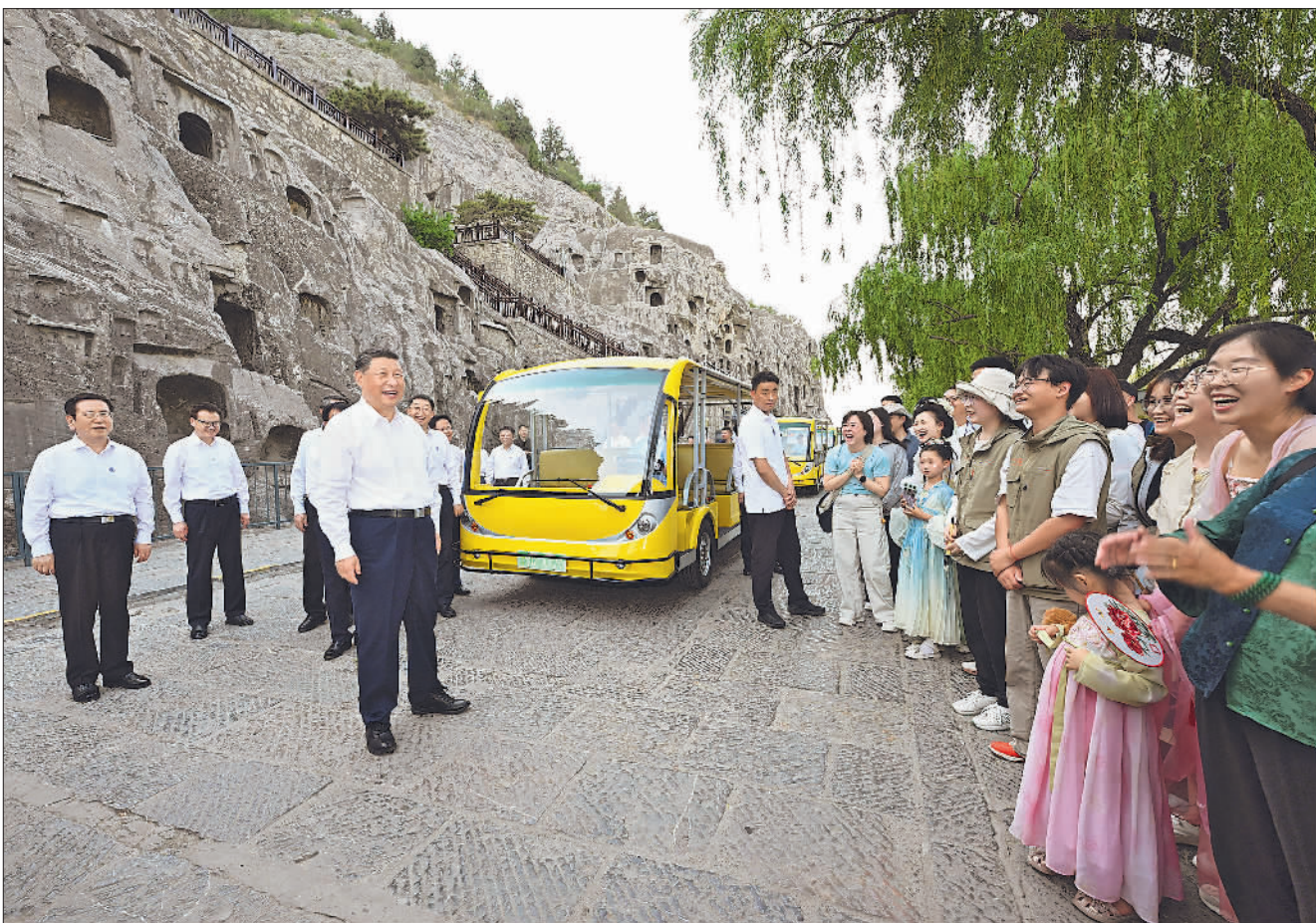
5月19日至20日，中共中央总书记、国家主席、中央军委主席习近平在河南考察。这是19日下午，习近平在洛阳龙门石窟考察时，同游客亲切交流。