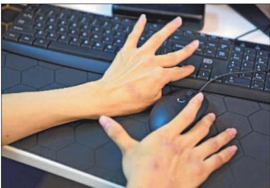
5月14日,一名残疾人在助残就业中心内通过网络进行自动售卖机后台审核标注工作。