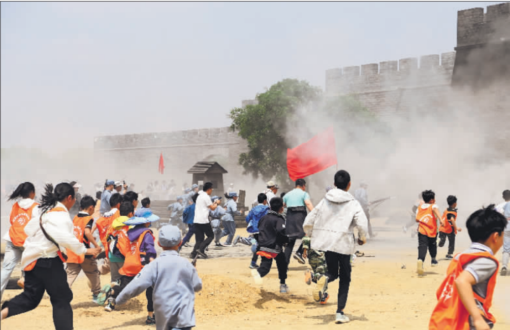
↑5月5日,山东临沂,游客沉浸式体验“战争”现场。