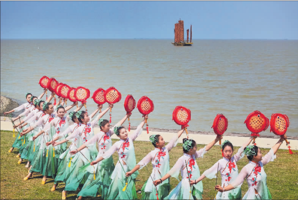
↑5月11日,江苏淮安,当地学生在大运河百里画廊洪泽湖古堰景区表演国家级非遗洪泽湖渔鼓。