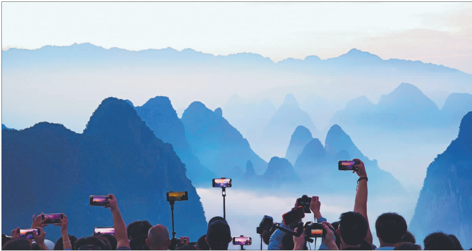
↑5月1日清晨,位于广西桂林的相公山景区,群山在晨雾中层峦叠嶂、若隐若现,游客纷纷举起手机和相机拍照。

文化和旅游消费促进活动,深化线上线下、商旅文体健多业态消费融合,推广跟着演出、影视、赛事、非遗去旅行等特色旅游模式,打造消费新场景,推出更多惠民乐民措施。 在这场双向奔赴中,“说走就走”逐渐成为大众旅游时代的新常态。 本期,我们从众多摄影作品中挑选出6幅佳作,邀请读者一起领略美好旅程中的锦绣山河。