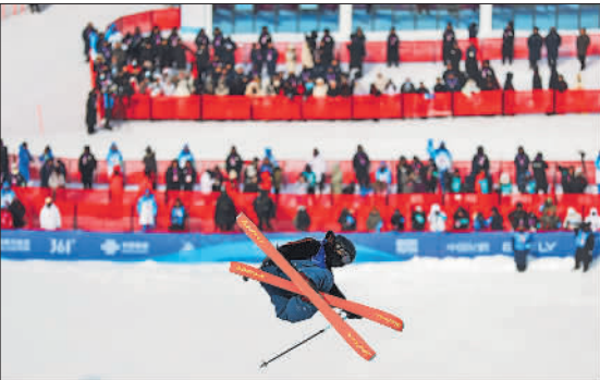
2月8日,黑龙江亚布力,在第九届亚冬会自由式滑雪男子U型场地技巧决赛现场,日本队选手松浦透磨在比赛中。