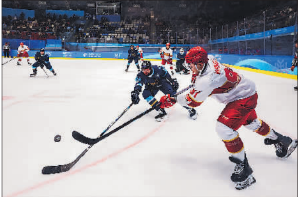
2月5日,第九届亚冬会男子冰球A组第二轮,中国队与哈萨克斯坦队在比赛中。