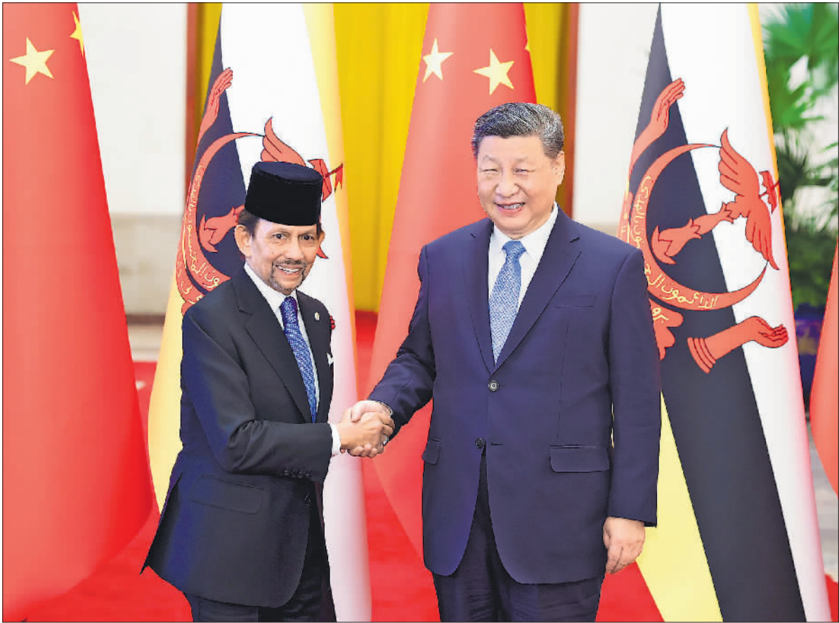
2月6日上午，国家主席习近平在北京人民大会堂同来华进行国事访问的文莱苏丹哈桑纳尔举行会谈。这是习近平同哈桑纳尔握手。

新华社北京2月6日电（记者邵艺博 董雪）2月6日上午，国家主席习近平在北京人民大会堂同来华进行国事访问的文莱苏丹哈桑纳尔举行会谈。 习近平指出，中传统友谊源远流长。建交30多年来，双方不断深化政治互信，积极对接发展战略，各领域务实合作取得丰硕成果，在国际和地区事务中保持良好配合，树立了大小国家平等相待、互利共赢的典范，也为地区和平稳定和发展繁荣作出了积极贡献。中国和文莱共建命运共同体，顺应时代发展大势，符合两国和两国人民根本利益，开启了两国关系崭新篇章。双方要乘势而上，深化互利合作和战略协同，彼此尊重、坦诚互信，永远做隔海相望的好邻居、相互信赖的好朋友、共同发展的好伙伴。 习近平强调，中方愿同文方在国家发展道路上携手前行，为两国人民带来更多福祉。双方要加强共建“一带一路”倡议同文莱“2035宏愿”战略对接，推进广西—文莱经济走廊、恒逸石化两个旗舰项目，打造中国—东盟东部增长区和“陆海新通道”双枢纽。中方愿鼓励更多企业赴文莱投资兴业，支持文莱发展数字经济、人工智能、新能源产业，助力文方经济多元化。中方支持两国开展杂交水稻研究合作，欢迎文方用好中国国际进口博览会、中国—东盟博览会等平台，扩大优质农渔产品对华出口。双方要弘扬人文交流优良传统，深化教育、文化、旅游、地方、体育交流合作，共同推动平等有序的世界多极化、普惠包容的经济全球化，捍卫国际公平正义，为促进国际和地区和平稳定发挥积极作用。 哈桑纳尔向习近平主席和中国人民致以蛇年新春祝福。哈桑纳尔表示，在习近平主席领导下，中国保持经济持续快速增长，让数亿人摆脱贫困，这是了不起的成就。中国提出三大全球倡议，为世界和平、稳定、发展发挥关键作用，展现了负责任大国担当。文莱和中国始终相互尊重、相互信任，两国关系持续发展，携手迈向文中命运共同体。感谢中方支持文莱经济多元化战略，两国合作使文莱人民受益。文方坚定奉行一个中国政策，愿同中方巩固战略合作伙伴关系，为两国人民带来更多福祉。文方愿与中方加强政治互信，深化贸易、农业、渔业、能源等领域合作，促进人文交流。当前，国际社会面临新的复杂局面和挑战，文方愿同中方加强合作，坚持多边主义和自由贸易，维护发展中国家共同利益。 双方发表《中华人民共和国和文莱达鲁萨兰国关于深化战略合作伙伴关系、推进中文命运共同体建设的联合声明》。 会谈后，两国元首共同见证签署司法、共建“一带一路”、经贸、媒体等领域多项合作文件。 会谈前，习近平在人民大会堂北大厅为哈桑纳尔举行欢迎仪式。 天安门广场鸣放21响礼炮，礼兵列队致敬。两国元首登上检阅台，军乐团奏中、文两国国歌。哈桑纳尔在习近平陪同下检阅中国人民解放军仪仗队，并观看分列式。当天中午，习近平在人民大会堂金色大厅为哈桑纳尔举行欢迎宴会。 王毅参加上述活动。