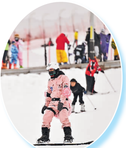
图为近日游客在银川市网海滑雪场滑雪。

今年冰雪产业的发展也十分可观。十四冬、全国大众冰雪季等系列赛事活动,进一步巩固和扩大北京冬奥会“带动三亿人参与冰雪运动”成果,助力“冷资源”释放“热消费”。2024国际冬季运动(北京)博览会上发布的《中国冰雪产业发展研究报告》显示,预计中国今年冰雪产业规模将达9700亿元。