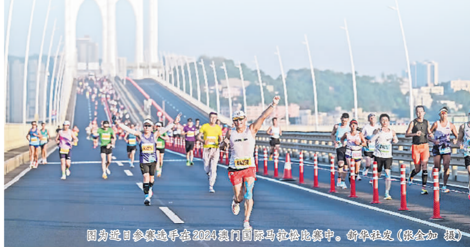
图为近日参赛选手在2024澳门国际马拉松比赛中。

与此同时,科学健身指导、运动项目普及与推广、技能培训等已送往千家万户。2024年,全国范围共开展“奋进新征程 运动促健康”全民健身志愿服务活动7000余场,各地开展全民健身志愿服务活动超过1.1万场。随着全民健身战略得到积极落实,全民健身事业在今年得到迅速发展,为健康中国、体育强国建设贡献丰硕成果。随着科技进步与体育产业的蓬勃发展,相信2025年,体育健身将以更加多元化、智能化、便捷化的方式融入群众日常生活。