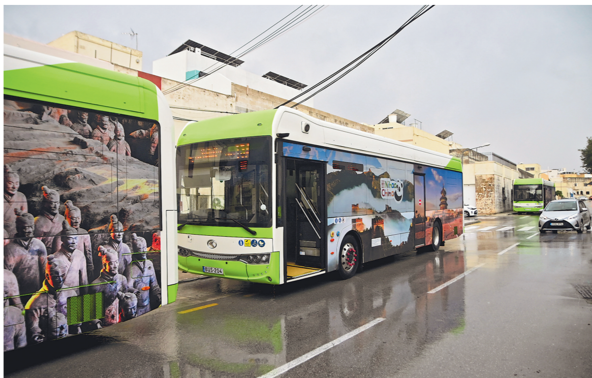
▲这是近日在马耳他桑塔露琪亚市拍摄的喷绘着中国著名景点和文化遗产图案的中国进口纯电动巴士。