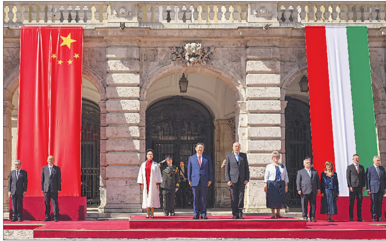
当地时间5月9日上午,国家主席习近平在布达佩斯出席匈牙利总统舒尤克和总理欧尔班共同举行的隆重欢迎仪式。