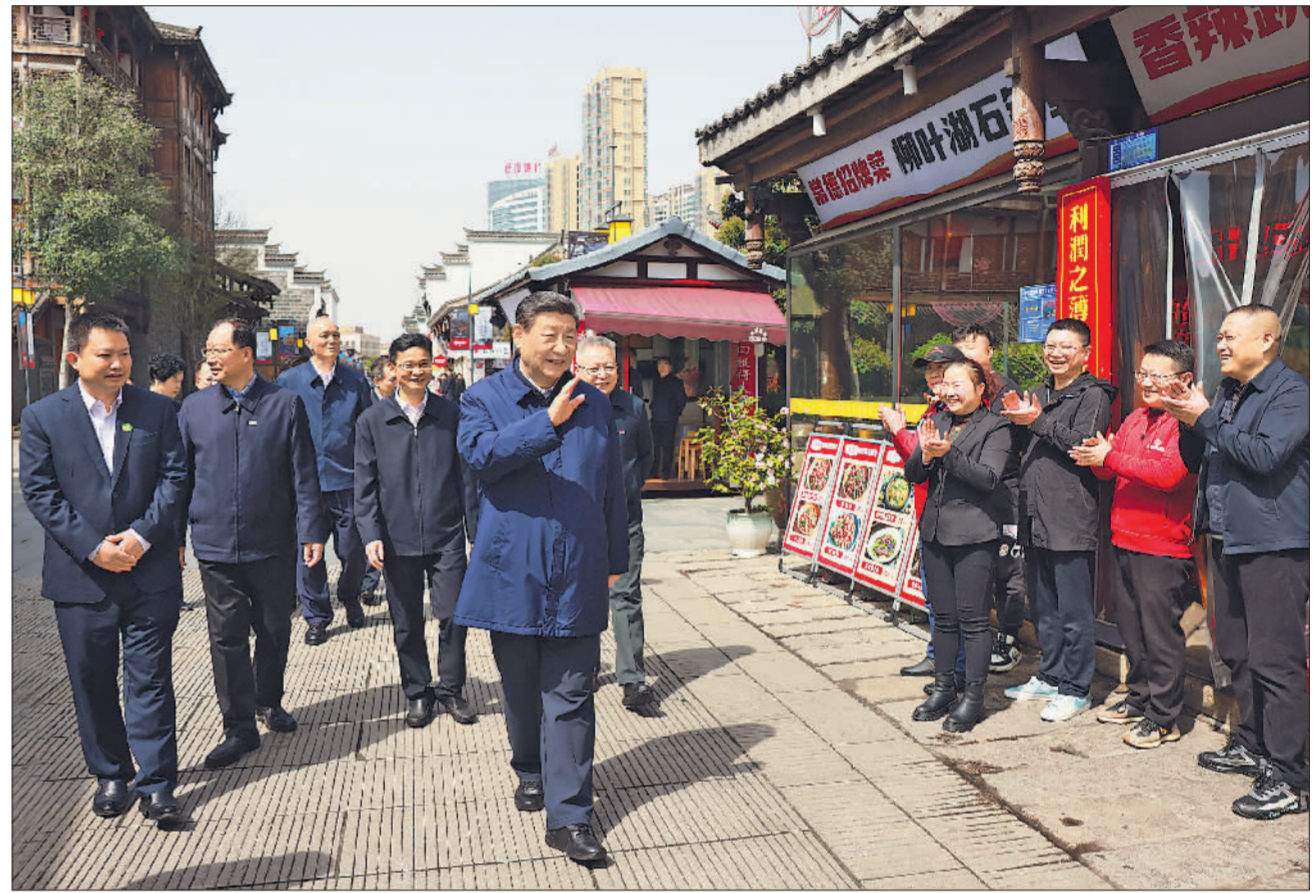
3月18日至21日，中共中央总书记、国家主席、中央军委主席习近平在湖南考察。这是19日上午，习近平在常德河街考察时，同店主和游客亲切交流。

新华社长沙3月21日电 中共中央总书记、国家主席、中央军委主席习近平近日在湖南考察时强调，湖南要牢牢把握自身在构建新发展格局中的战略定位，坚持稳中求进工作总基调，坚持高质量发展不动摇，坚持改革创新、求真务实，在打造国家重要先进制造业高地、具有核心竞争力的科技创新高地、内陆地区改革开放高地上持续用力，在推动中部地区崛起和长江经济带发展中奋勇争先，奋力谱写中国式现代化湖南篇章。