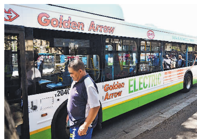
南非开普敦的中国新能源公交车

从2月29日起,包括法塔赫、哈马斯和杰哈德等派别在内的巴勒斯坦各派在俄罗斯举行会谈,讨论组建一个统一的巴勒斯坦政府和对加沙地带重建问题。然而,考虑到美国的施压,以色列在财政方面的掣肘以及巴内部分歧,即使能组建新政府,其命运很可能同样艰难。对阿什提耶个人来说,此时离去未必不是一种解脱。