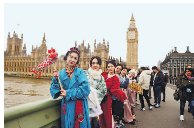
英伦街头的汉服韵味

不过,近期民调显示,76%的受访者认为扩招医学生政策“利大于弊”,同时超过80%的韩国民众支持政府对罢工医生采取强硬态度。可见大多数韩国民众此次站在支持政府改革举措的立场上。