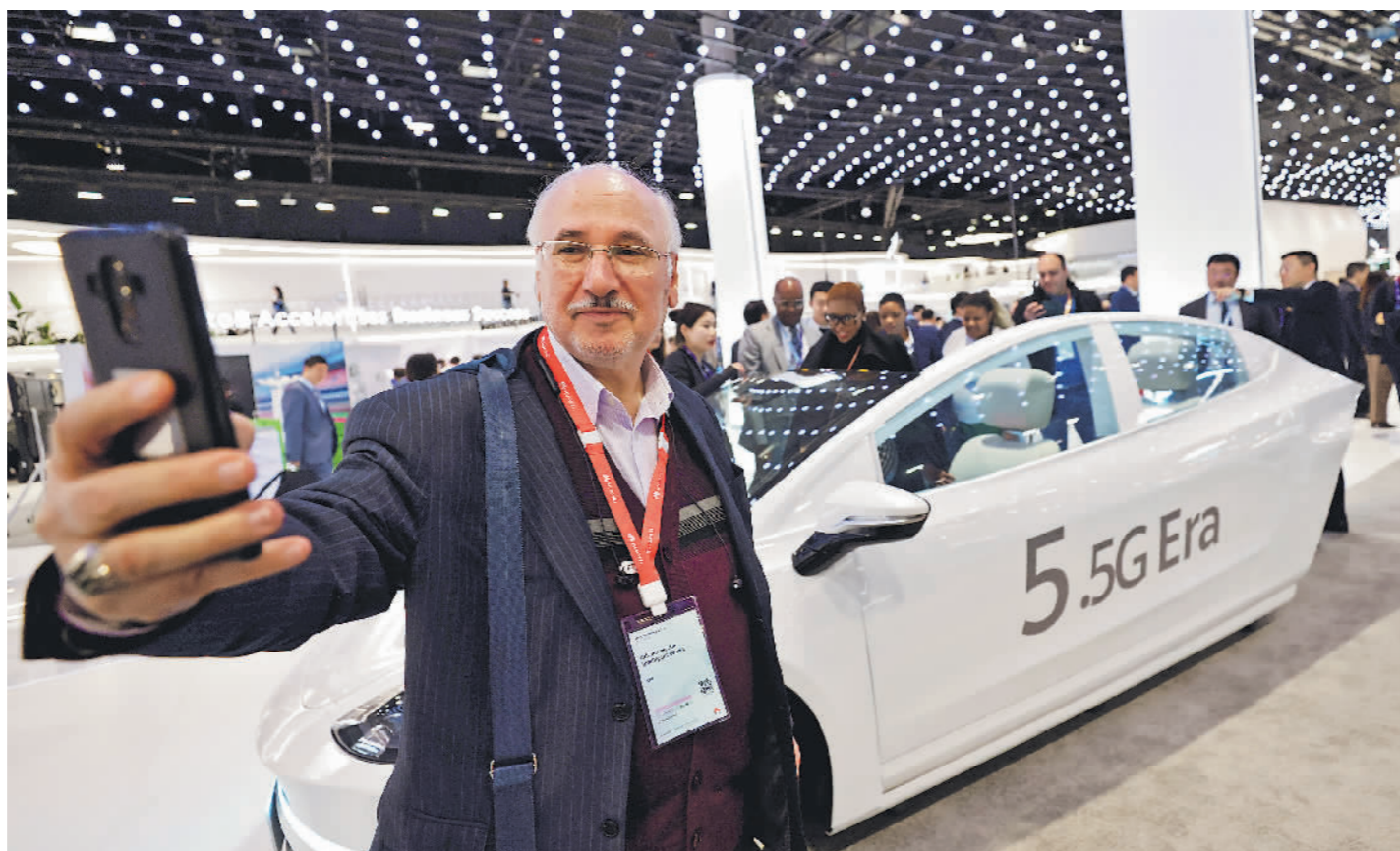
世界移动通信大会关注5G-A技术

2024年世界移动通信大会近日在西班牙巴塞罗那举行。大会期间,在5G技术基础上演进而来的5G-A技术备受关注,一些业界人士认为今年是5G-A商用元年。图为2024年世界移动通信大会上,一名参观者在华为展台一辆无人驾驶汽车前自拍。