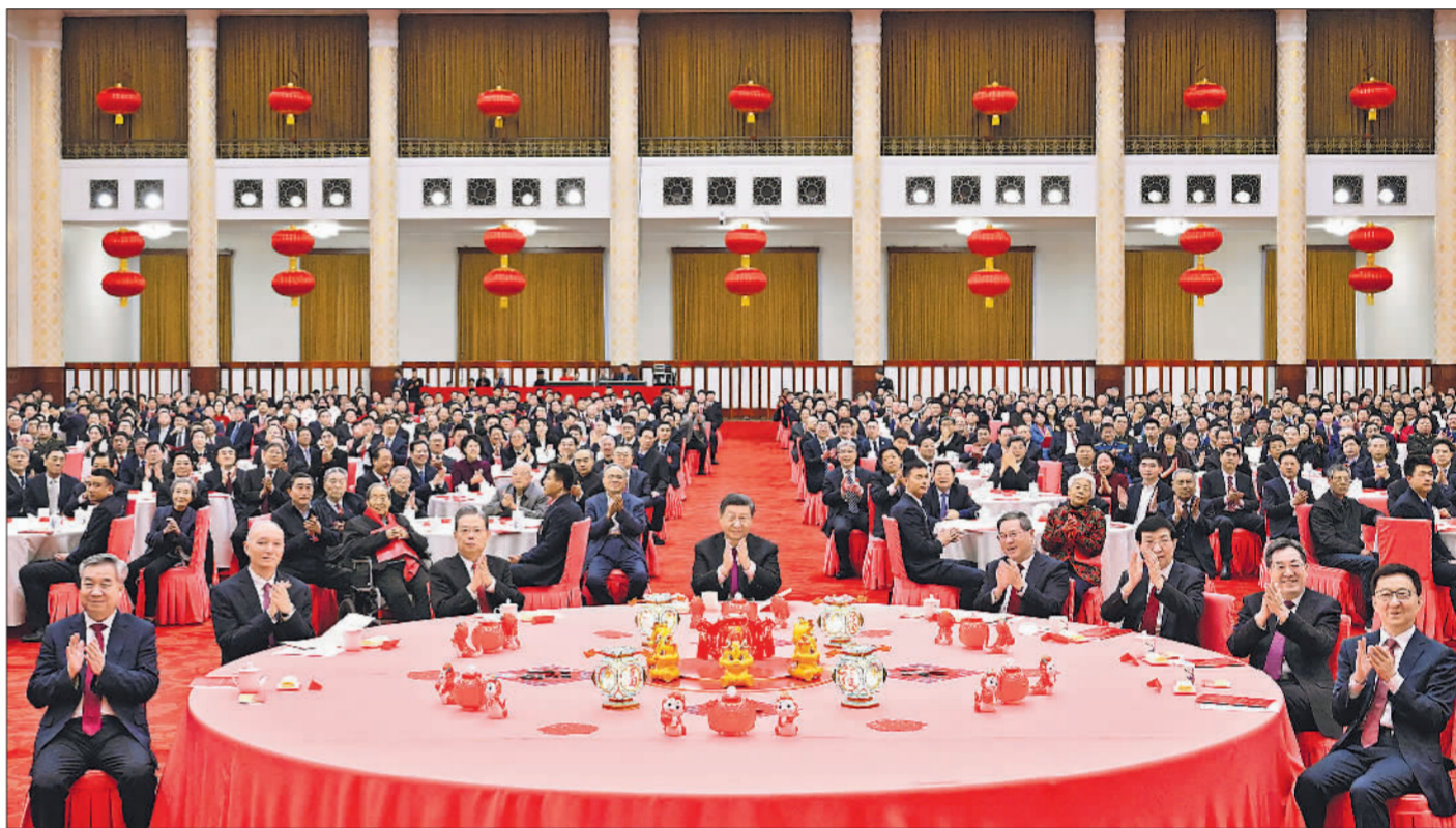
2月8日,中共中央、国务院在北京人民大会堂举行2024年春节团拜会。党和国家领导人习近平、李强、赵乐际、王沪宁、蔡奇、丁薛祥、李希、韩正等同首都各界人士齐聚一堂,共迎新春。

■回顾一年来的拼搏奋斗,我们更加深切地体会到,以中国式现代化全面推进强国建设、民族复兴伟业,既是中国人民追求美好幸福生活的光明之路,也是促进世界和平发展的正义之路。只要我们坚持道不变、志不改,一以贯之、勠力同心,就一定能够战胜前进中的各种艰难险阻,不断迈向成功的彼岸