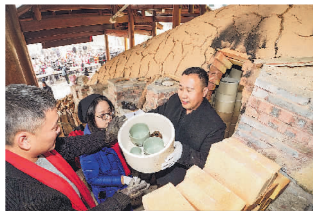
陶山窑新年第一窑开窑

贵州各地在摸清“红色家底”的基础上,将分散零落的红色资源连点成线、串珠成链,让更多红色文化资源在新时代焕发新光彩。据长征国家文化公园规划指导工作专班统计,2020年至今,贵州累计发布了34条红色旅游精品线路、10条重走长征路徒步旅行线路、首批10个最美红军村,为长征国家文化公园建设和旅游市场复苏积极助力。