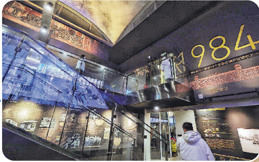
观众在烟台工业博物馆参观烟台历史。

活动还为央博数字传媒、首都博物馆、腾讯数字文化实验室、西城区文物保护中心等15家文物数字化创新联盟成员单位授牌。