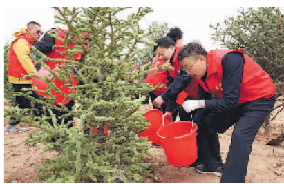
“劳模林”里种下“绿色希望”。

推进县级工会规范化建设,完善“小三级”工会组织体系,推动全区乡镇、街道、社区及25人以上企业全部建立工会组织。全面开展“重点建、行业建、兜底建”,推动工会组织不断向中小微企业、新经济组织延伸,力争新就业形态劳动者建会入会率达到60%以上。持续推进人财物向基层工会倾斜,探索开展兼职