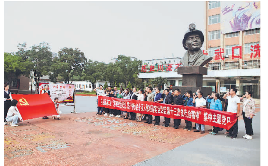
宁夏总工会开展集中主题党日活动。

深入推进工会干部作风建设。进一步完善工会工作评价办法,完善评先评优工作机制,开展“特别突出贡献奖”“工作创新创优奖”选树工作,常态化组织开展“亮晒评比促”“互学互促”活动。加强工会干部队伍建设,选优配强各级工会领导班子,锻造绝对忠诚可靠的工会干部队伍。分层次开展工会干部业务能力全覆盖培训,加强党员干部岗位练兵,完善业务骨干“传帮带”工作机制,增强各级工会干部解决实际问题的本领和能力,培养更多行家里手,当好职工群众最可信赖的“娘家人”。(文/陈伟红)