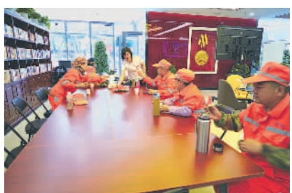
宁夏总工会职工服务中心为环卫工人提供贴心服务。