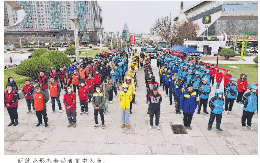
新就业形态劳动者集中入会。