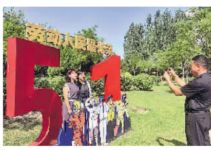
各处新建的劳动公园成了市民新打卡地。

工会主席津贴补贴制度。加快智慧工会建设。大力推进工会数字化转型工作,建设实名动态、全面覆盖、安全共享的工会大数据系统和服务平台,推动工会活动网上开展,工会业务网上办理,促进互联网与工会工作深度融合。大力推进“12351”工会服务热线建设,将其打造成新时代工会系统及时、高效解决职工群众“急难”问题的“重要渠道”和“亮丽品牌”。