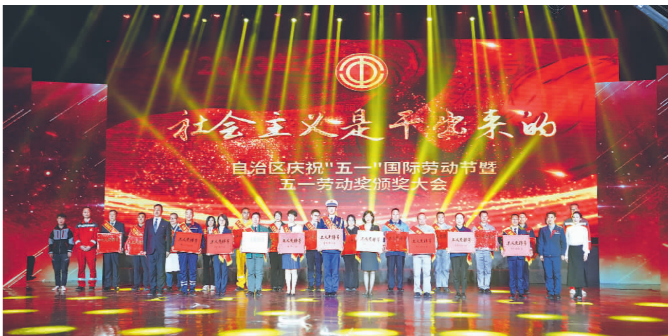
宁夏庆祝“五一”国际劳动节暨五一劳动奖颁奖大会。

——始终牢记工会是党联系职工群众的桥梁和纽带,不断深化自身改革和建设,工运事业蓬勃发展的内生动力更加强劲。各级工会领导班子按照“专职+兼职+挂职”的模式增聘兼职、挂职副主席,区总常委会和委员会劳模和一线职工比例分别提高1.7、2.1个百分点;优化区总内部机构设置,着力构建科学规范、运行高效的工作机制。持续加强基层组织工作,全区工会会员数增长至129万人;建设“智慧工会”,搭建网上建会、入会、维权服务新模式。坚持以党建带工建,培育打造了“党建引领合力、工会服务在身边”党建品牌。建立工会干部赴基层“三蹲六联”等工作机制;严格落实中央八项规定精神和自治区党委实施细则要求,加强对重点岗位、重要工作的规范管理和监督。