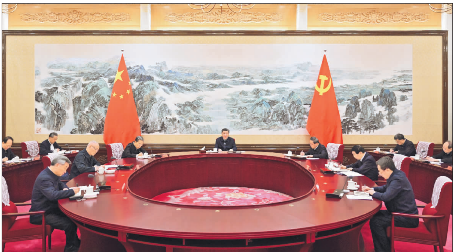
12月21日至22日,中共中央政治局召开学习贯彻习近平新时代中国特色社会主义思想主题教育专题民主生活会,中共中央总书记习近平主持会议并发表重要讲话。

■一年来的实践再次证明,“两个确立”对于我们应对各种风险挑战、推进中国式现代化建设具有决定性意义。全党全军全国人民必须深刻领悟“两个确立”的决定性意义,增强“四个意识”、坚定“四个自信”、做到“两个维护”,坚定不移贯彻落实党中央方针政策和决策部署。