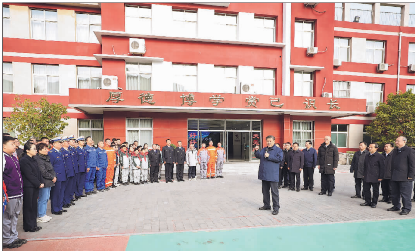
11月10日，中共中央总书记、国家主席、中央军委主席习近平在北京门头沟妙峰山民族学校，亲切慰问因公牺牲烈士家属和参与防汛抗洪救灾的基层党员干部群众、消防及应急救援人员、国企职工、志愿者代表等。