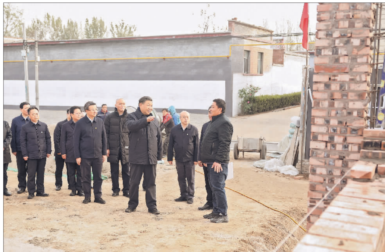
11月10日，中共中央总书记、国家主席、中央军委主席习近平在北京、河北考察灾后恢复重建工作。这是10日下午，习近平在河北保定涿州市刁窝镇万全庄村房屋重建施工现场考察。

在这场抗洪抢险救灾斗争中，基层党员干部冲锋在前、勇于担当，人民解放军、武警部队官兵、消防救援队伍指战员挺身而出、向险前行，国有企业职工闻“汛”而动、紧急驰援，社会各界和志愿者积极参与、奉献爱心，书写了洪水无情人有情的人间大爱，展现了社会主义制度一方有难、八方支援的显著优势和全国人民万众一心、同舟共济的奋斗精神，涌现出许多感人故事