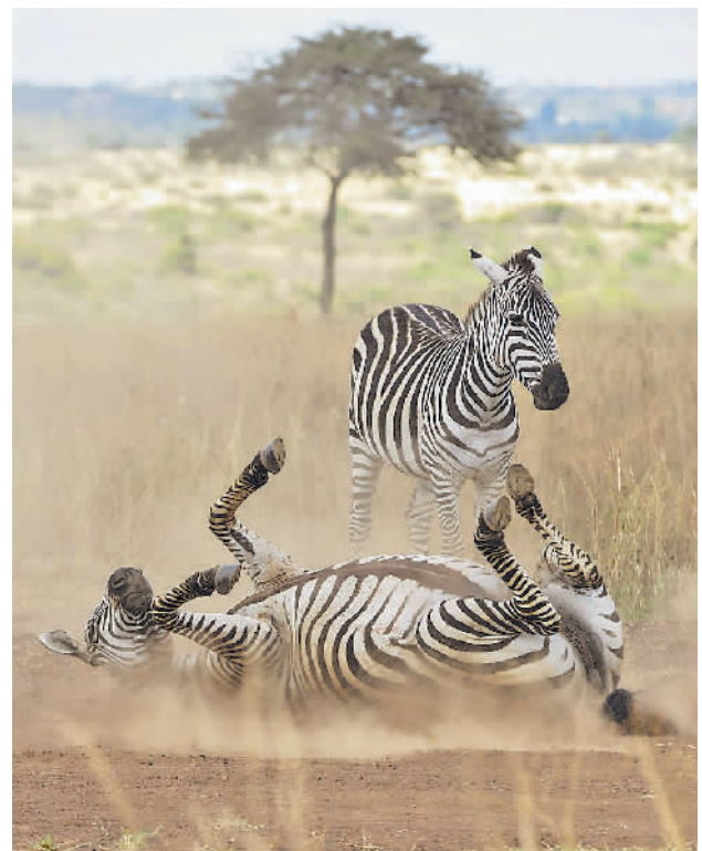
内罗毕国家公园的野生动物

谷村新司曾说:“我希望我的音乐,能给听到的人带去幸福,希望人们从我的音乐中获得力量,努力前行。”相信在今后,谷村新司的音乐会继续洗涤更多人的心灵,为这个世界带来更多的幸福。