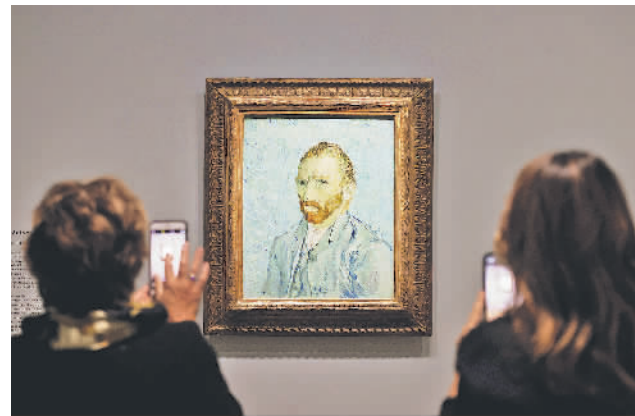
梵高画展亮相法国奥赛美术馆

除了可能造成欧洲各国及欧盟内部的分裂外,欧洲理事会主席米歇尔13日还警告称,当下巴以地区爆发这场冲突,可能将导致更多的中东难民涌入欧洲,而这不仅会引发反移民人士的抗议,还将进一步加剧欧洲内部巴勒斯坦和以色列支持者之间的紧张关系。