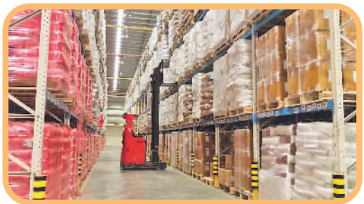
↓京东物流越南胡志明仓。