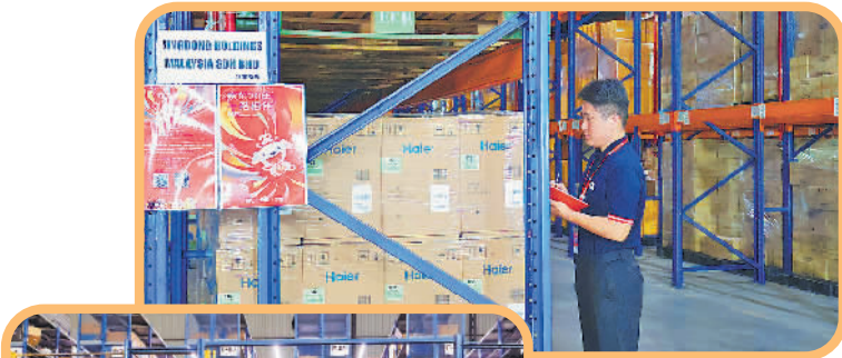
↑在马来西亚吉隆坡的京东自营1号仓里,京东物流员工正在清点货物。