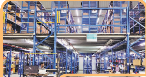
↑京东物流马来西亚吉隆坡1号仓。