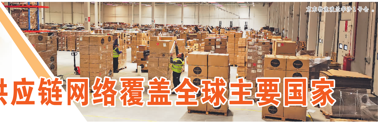
京东物流波兰华沙1号仓。