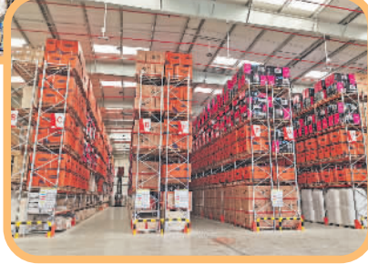
←京东物流阿联酋迪拜1号仓。