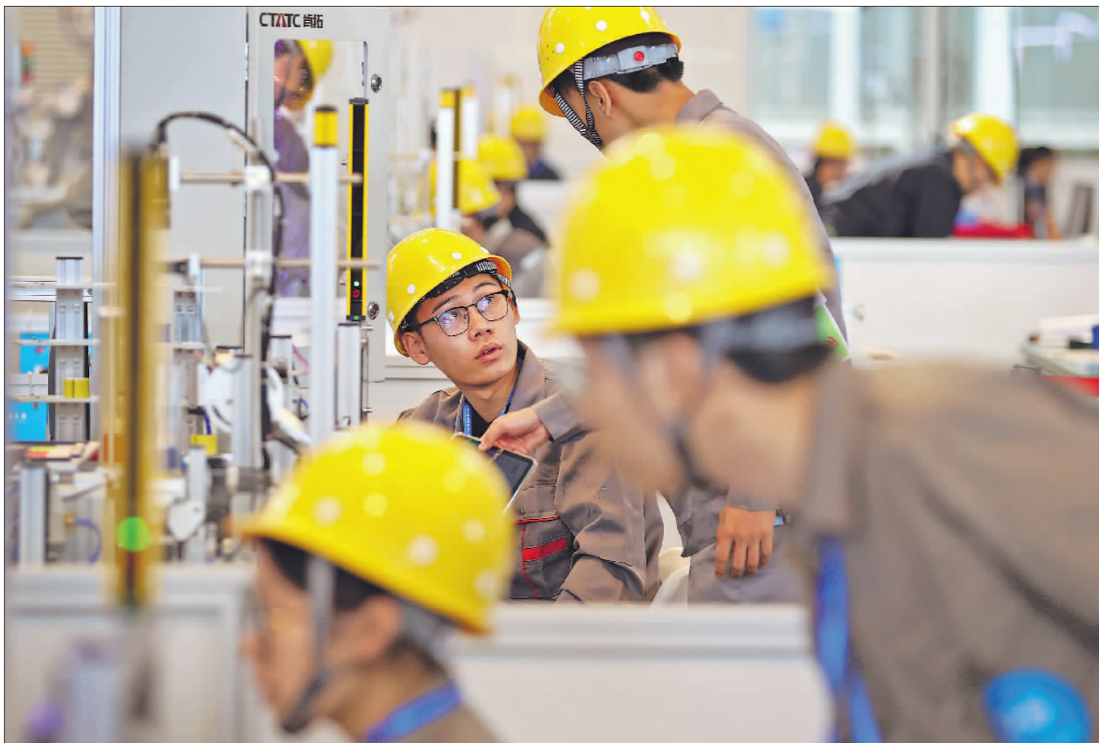
9月17日,选手们在机器人系统集成项目比赛中。随着产业升级,在装备制造、汽车制造、电子产品制造等领域,机器人系统集成被广泛运用在生产升级的过程中,对相关产业工人的要求也越来越高。