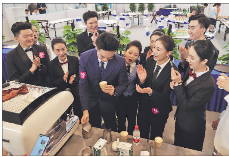
9月18日中午,在餐厅服务项目比赛结束后,参赛选手们在等待裁判打分之余,各自展示技艺、交流经验、学习对手的长处。