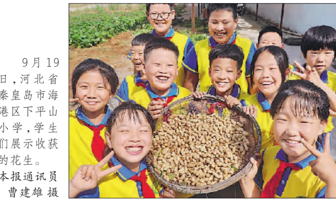
9月19日,河北省秦皇岛市海港区下平山小学,学生们展示收获的花生。