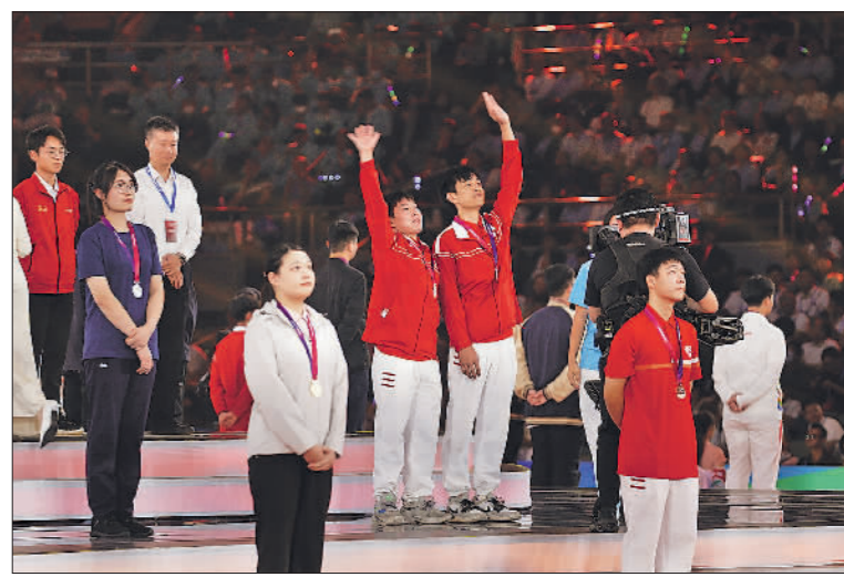
9月19日,在第二届全国技能大赛闭幕式颁奖典礼上,获奖选手向现场观众挥手致意。