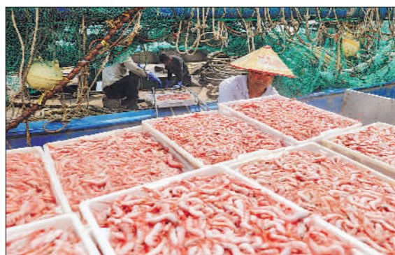
9月17日,浙江省舟山市普陀区舟山国际水产城码头,工人正在搬运刚刚捕捞的渔货。据悉,9月16日东海全面开渔,大批渔船集中出海捕捞。