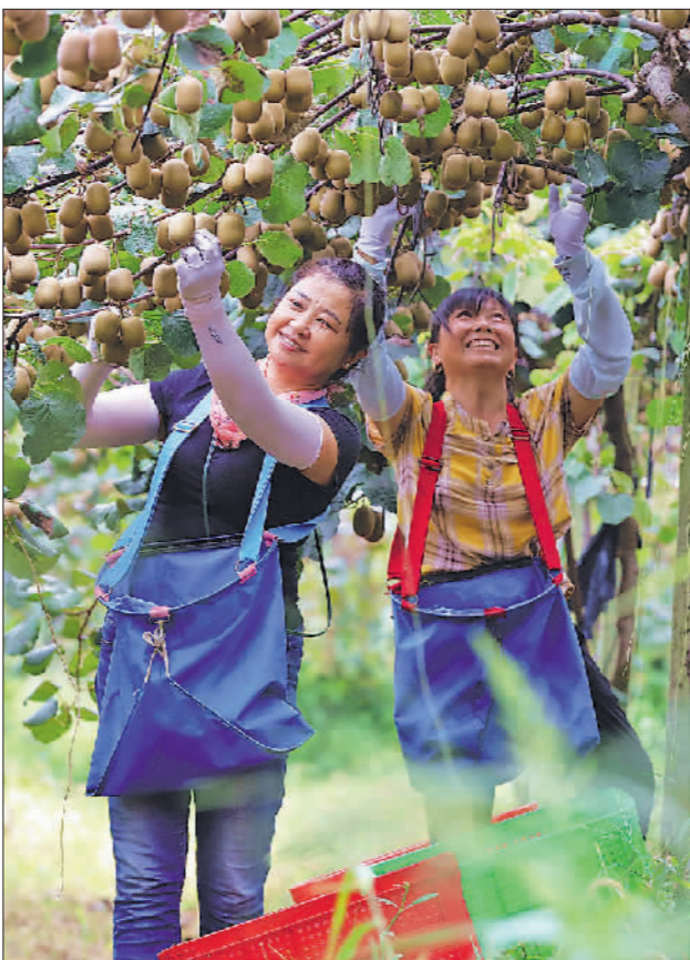
→9月12日,在安徽省安庆市大湖县大石乡猕猴桃种植基地,村民正在采摘猕猴桃。