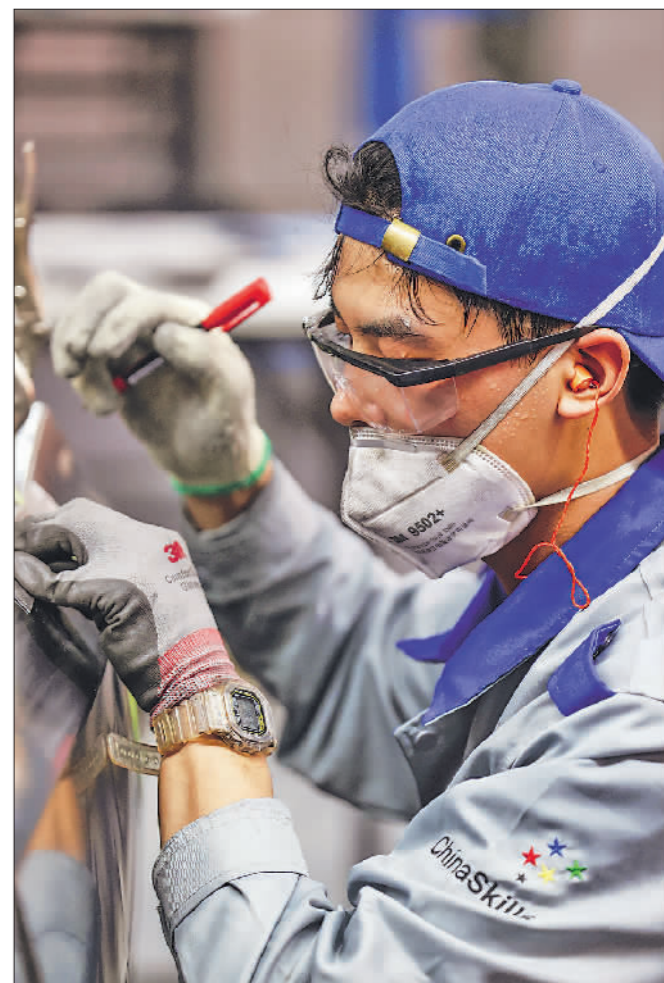
9月17日,车身修理项目比赛现场,一名参赛者专注在比赛中,不知不觉间已满头大汗。

9月16日至19日,第二届全国技能大赛在天津举行。本届大赛以“技能成才、技能报国”为主题,4045名选手角逐109个项目奖牌。老师傅与小工匠、学生与企业职工同台竞技,各展绝活,互相交流学习,让大赛现场成为匠星闪耀的舞台。