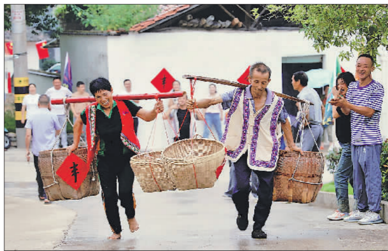
9月5日,安徽省宁国市云梯畲族乡白鹿村,“赛丰收·快乐健身”活动现场。当日,“民族团结进步宣传月”暨“云梯畲族乡农民丰收节”系列活动启动。