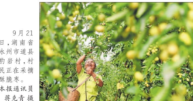
9月21日,湖南省永州市道县豹岩村,村民正在采摘酥脆枣。