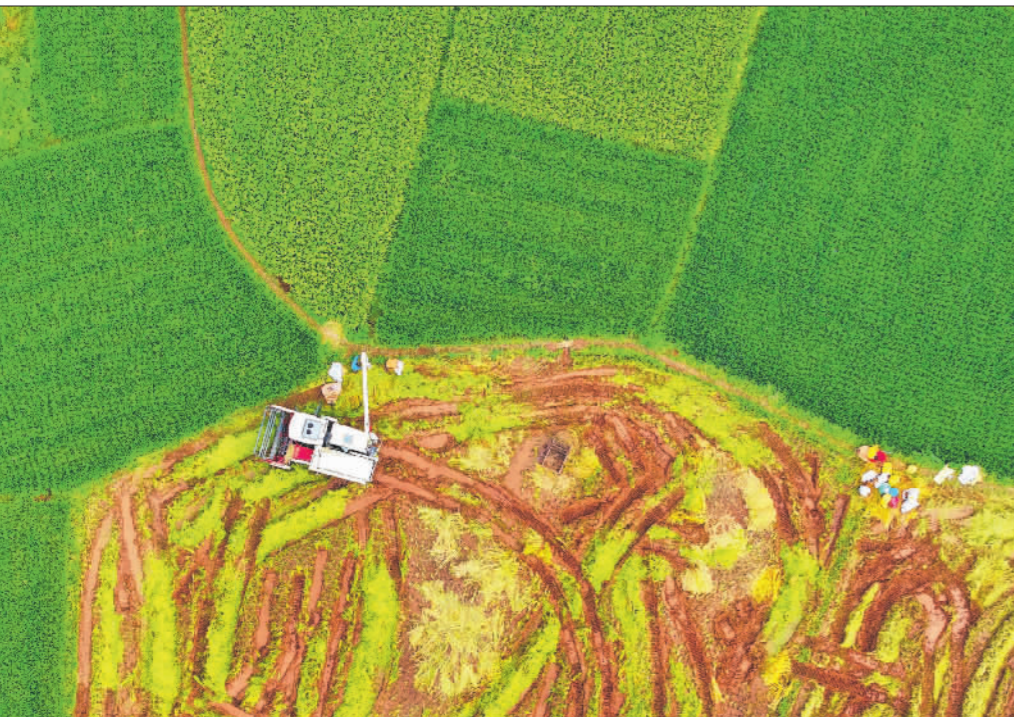
↑9月18日,江西省赣州市信丰县正平镇黄田村,村民驾驶着收割机在田间收割水稻。

←9月19日,贵州省铜仁市松桃苗族自治县九江街道小桂寅社区的农民在晾晒玉米。连日来,当地水稻、玉米、大豆等迎来丰收季,农民抢抓晴好天气,采收、晾晒,确保秋粮颗粒归仓。