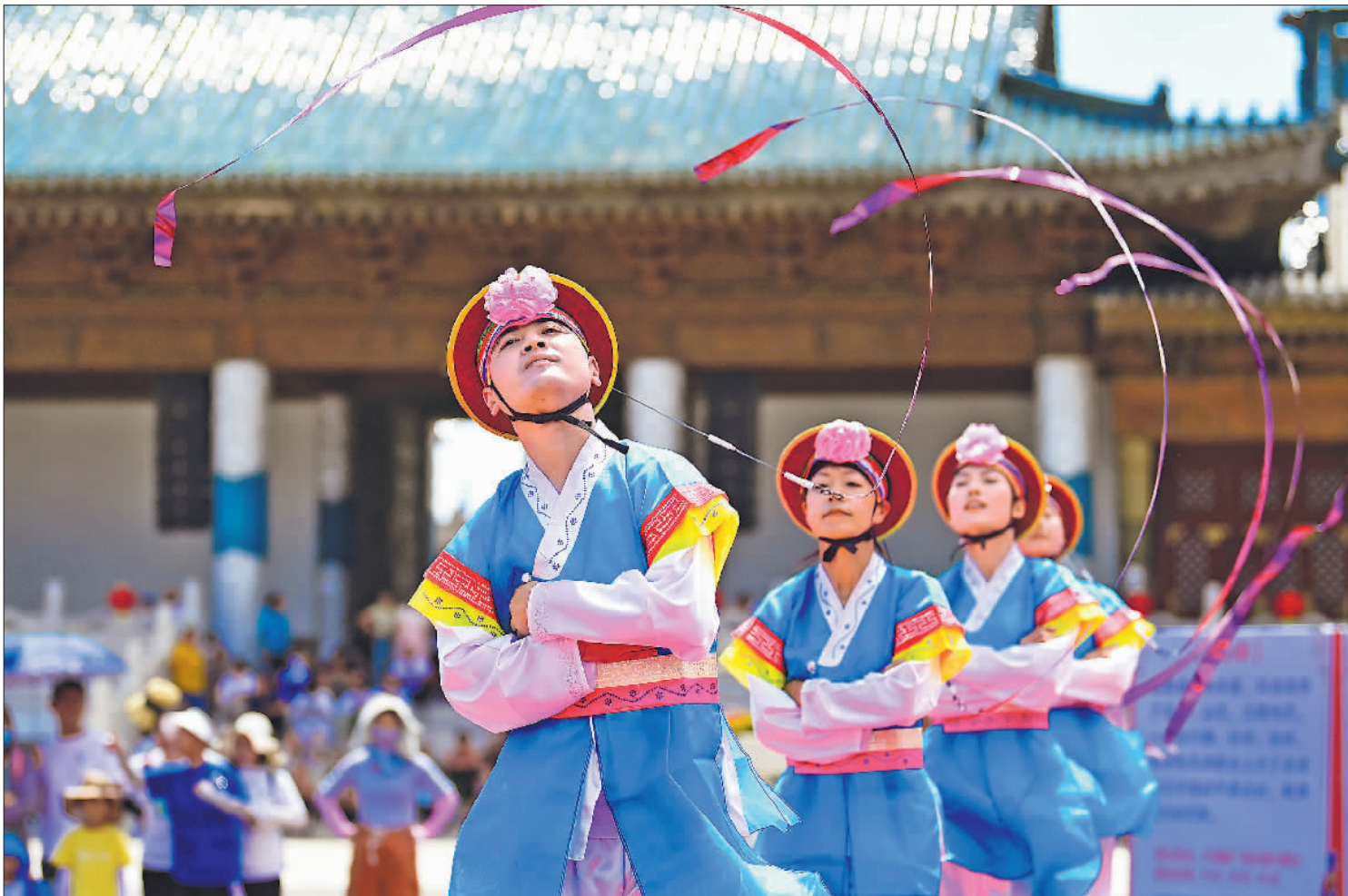
8月13日，在鄂尔多斯文化产业园景区，非遗传承人表演朝鲜族象帽舞。 当日，为期15天的内蒙古伊金霍洛旗2023首届九州非遗绝技文化旅游节暨非遗旅游嘉年华在鄂尔多斯文化产业园景区开幕。来自全国各地的民间艺人为游客表演舞狮、高跷、木偶戏等特色节目，展现非遗文化和民间艺术的魅力。

据新华社电 （记者吉宁）记者从中国人民银行营业管理部获悉，针对近期首都地区出现极端强降雨，引发洪涝和地质灾害等情况，中国人民银行营业管理部加强货币政策工具保障，单列100亿元支农、支小再贷款额度和50亿元再贴现额度用于支持相关金融机构做好灾后金融服务工作。 据了解，中国人民银行营业管理部会同北京市相关部门联合向辖内相关金融机构印发帮扶支持灾后重建的通知，提出9方面要求，包括加大受灾主体信贷支持、积极服务灾后恢复重建、推出应急救灾专属服务、提高信贷审批效率、争取贷款降本减负等。 其中，对于地方法人银行发放的用于民生物资保供、灾后重建和复工复产的贷款，等额提供再贷款支持并放宽再贷款担保品要求；对于房产、门头沟、昌平等地区企业的票据融资，优先给予再贴现支持。相关金融机构对符合再贷款、再贴现支持政策的信贷业务，应进一步降低企业融资成本。