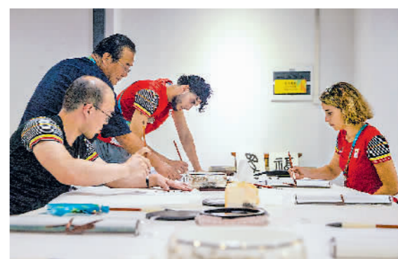
←8月1日,成都大运村,外国代表团成员在老师的指导下尝试使用毛笔书写汉字、画中国画。

→8月2日,成都大熊猫繁育研究基地,外国运动员用手机记录下大熊猫的萌态。成都大运会期间,这里成为参赛代表团成员的热门打卡地。