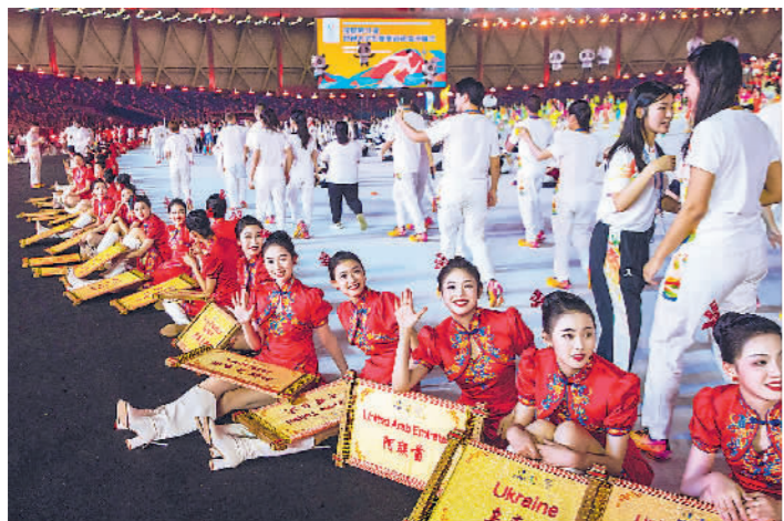
↑7月28日,第31届世界大学生夏季运动会开幕式结束后,引导员坐在地上休息。有别于以往运动会引导牌,成都大运会100多个引导牌是用蜀绣技艺绣制在蜀锦上的。