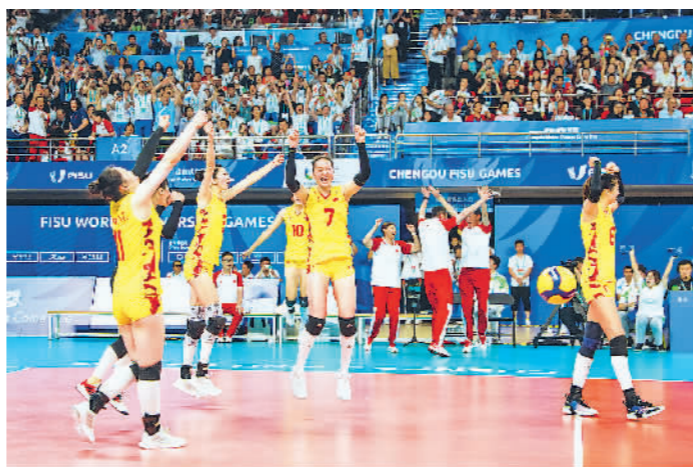
↑8月6日,第31届世界大学生夏季运动会女子排球金牌赛,中国队以3比0战胜日本队,夺得冠军。图为中国队球员在最后一球得分后庆祝。