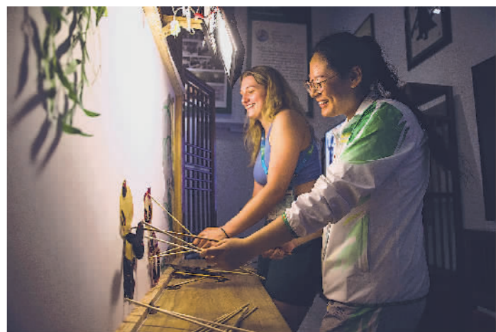
↑8月1日,成都大运村,一名外国运动员在志愿者的指导下体验皮影戏。