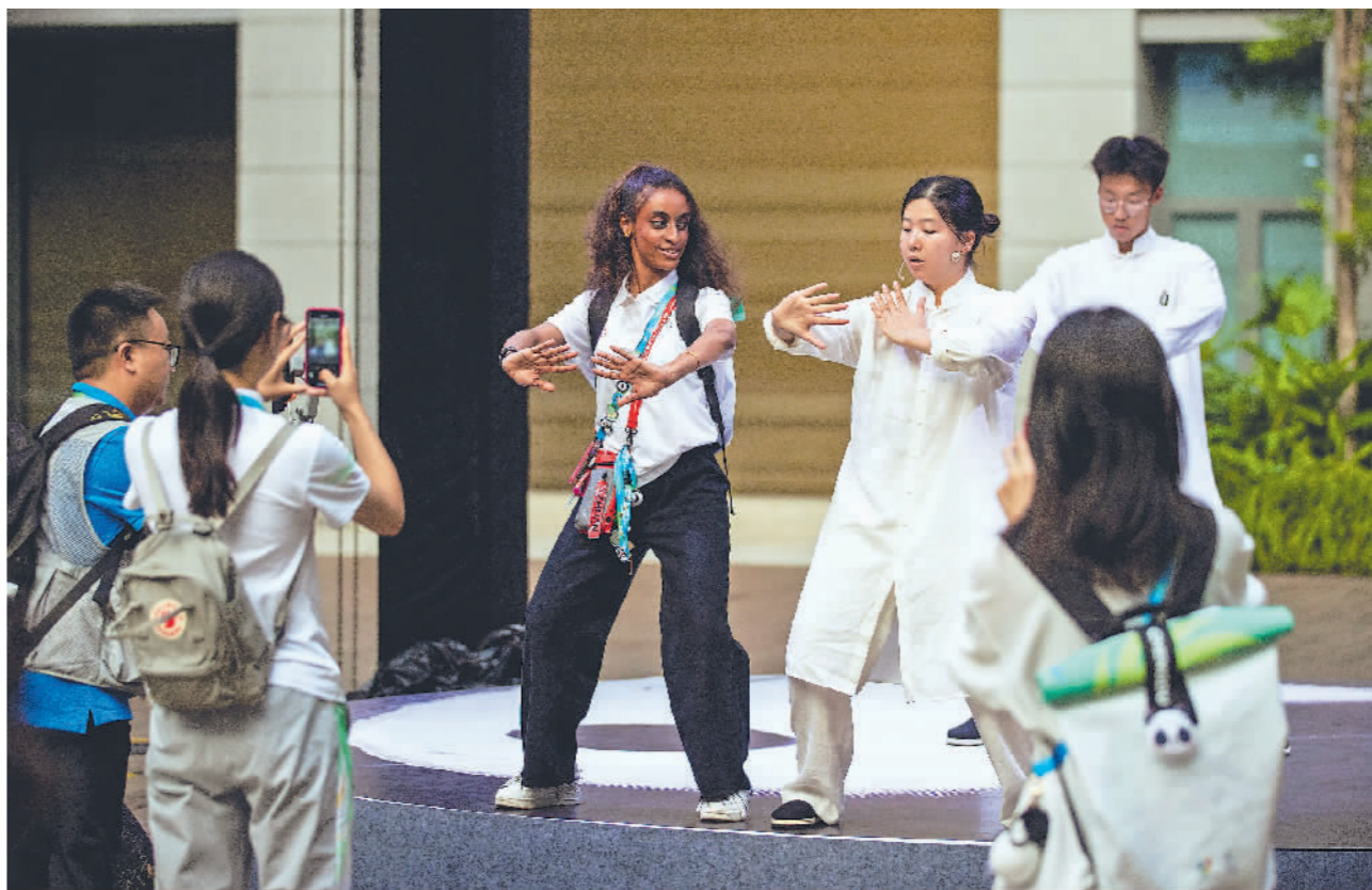
←8月1日,成都大运村,来自青城山的武术教练向外国运动员教授太极拳。