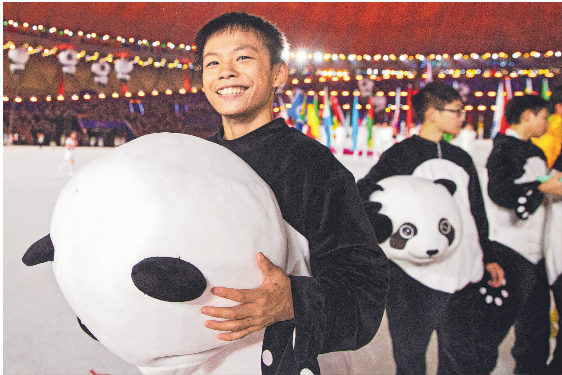
→7月28日,在成都举行的第31届世界大学生夏季运动会开幕式结束后,小演员摘下头套,露出青春的笑容。

8月8日,第31届世界大学生夏季运动会在成都落下帷幕。这是青春的盛会、团结的盛会、友谊的盛会。在12天的时间里,113个国家和地区的6500名青年运动员在成都相聚,在拼搏中追逐梦想,在相知中增进友谊,奏响青春华彩乐章。