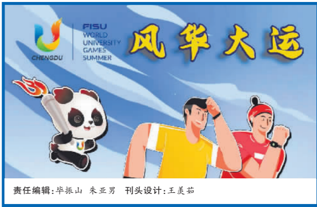
责任编辑:毕振山 朱亚男 刊头设计:王美茹

本报成都8月8日电(记者李元浩)今天上午,在成都大运会即将落幕之际,国际大体联代理主席雷诺·艾德和秘书长艾瑞克·森超,在主媒体中心畅谈各自对成都大运会的深刻感受。在总结成都大运会时,雷诺·艾德表示:“成都大运会非常精彩,让我们每个人都实现了梦想。这里的一切都非常完美。”