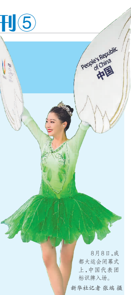
8月8日,成都大运会闭幕式上,中国代表团标识牌入场。