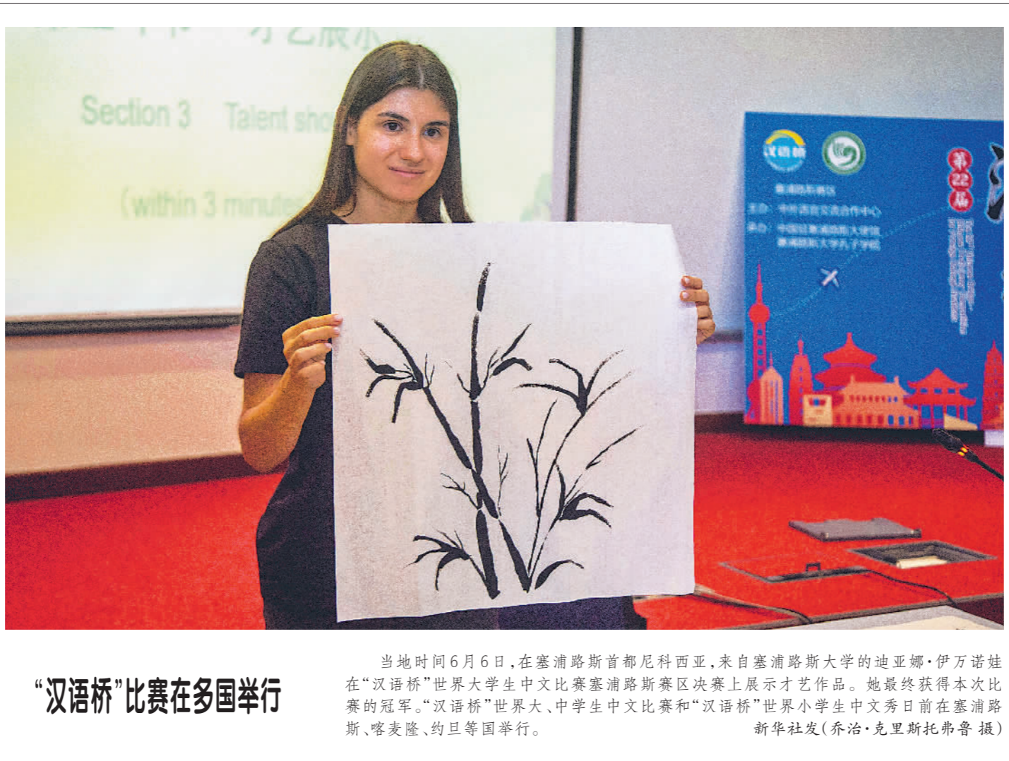
“汉语桥”比赛在各国举行

埃及旅游和文物部近日表示,今年4月埃及共接待国际游客135万人次,创历史最高月度水平。埃及预计今年可接待国际游客1500万人次,打破2010年创下的纪录。据报道,新冠疫情曾对埃及旅游业造成重大损失,但目前该国旅游业正在逐步复苏。2022年埃及接待国际游客约1170万人次,比2021年增加46%。埃及最近还放松了针对一些国家的签证,以方便更多游客到来。(郭译 辑)