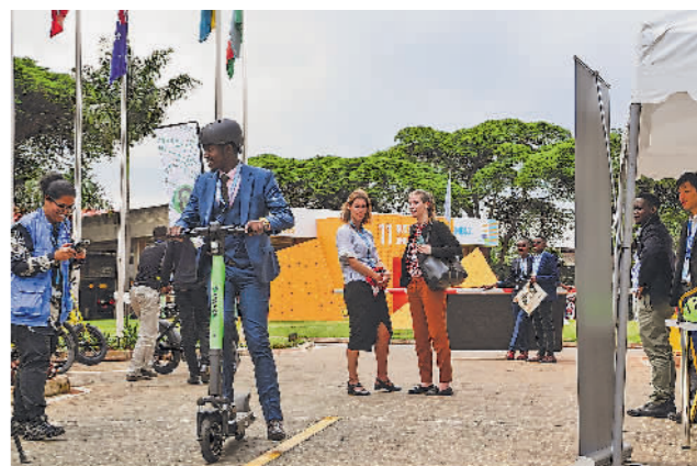
内罗毕举行低碳和电动交通载具展

此外,报告强调,国际商定的政策可以帮助克服国家规划和商业行动的局限性,维持繁荣的全球循环塑料经济,释放商业机会并创造就业机会。