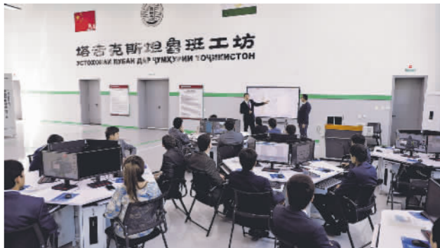
走进中亚首家鲁班工坊

科技创新，如新型环保建筑材料等，提高能源利用率，以期早日实现碳中和。 德国经济部长哈贝克表示，德国正在建设新液化气接收站和发展可再生能源，能源供应能得到保障。 但根据德国联邦统计局数据，2022年，传统能源发电占德国总发电量比例高达53.7%，其中燃煤发电占33.3%，核能占6.4%。此外，德国颇为看重的氢能，技术前景尚不明朗，生产成本更是十分高昂。 对此，德国政府承认，短期内，将不得不增加煤炭和天然气来满足其能源需求。 相对于德国等国的激进“弃核”，以法国为首的更多欧洲国家主张面对现实，继续利用便宜高效的核能，填补能源空缺，解决眼前困境。 今年2月，法国、匈牙利、芬兰、荷兰、波兰、捷克共和国等11个欧盟成员国发表联合声明，重申他们希望加强欧洲在核能领域的合作。该声明称，“核能是实现我们的气候目标、确保生产基本负荷电力和供应安全的众多工具之一”。