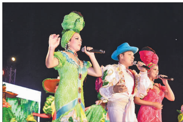
第41届古巴国际旅游博览会火热开启

为吸引更多游客,埃及旅游部门近期出台诸如落地签等一系列便利措施。(据新华社开罗5月3日电)