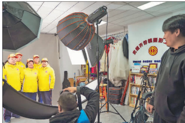
劳模摄影队为劳动者留影

社会主义现代化国家的火热实践,为推动高质量发展、实施制造强国战略贡献智慧和力量。 在强国建设、民族复兴的新征程上,练技能、强本领,做高素质的劳动者。亿万职工是创新驱动发展的骨干力量。我们要努力成为知识型、技能型、创新型劳动者,树立终身学习的理念,适应当今世界科技革命和产业变革的需要,勤学苦练、深入钻研,勇于创新、敢为人先,不断提高技术技能水平,走技能成才、技能报国之路。 职工同志们,强国建设、民族复兴的接力棒,历史地落在我们这一代人身上。让我们更加紧密地团结在以习近平同志为核心的党中央周围,在百舸争流、千帆竞发的洪流中勇立潮头,奋进新征程、建功新时代,成就无愧于时代、无愧于韶华的新业绩,谱写壮丽而崭新的劳动篇章!