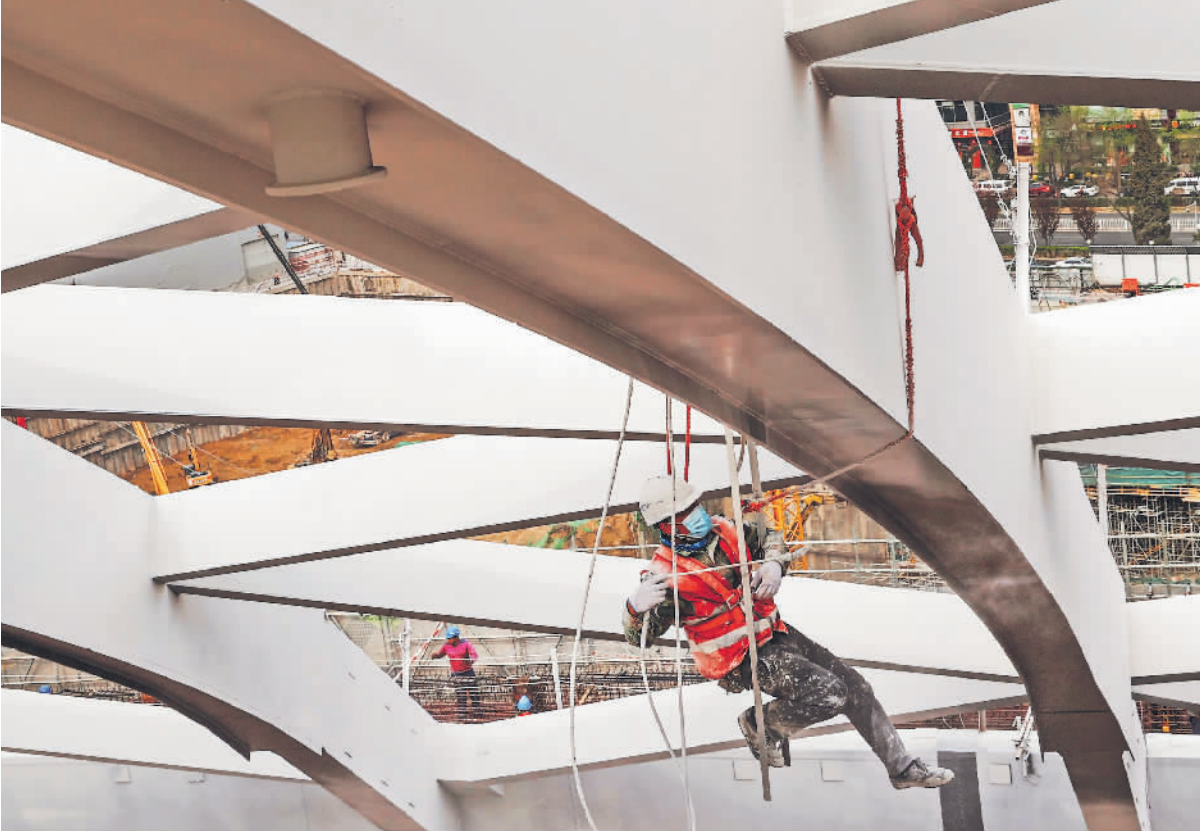
2022年4月10日,北京工人体育场建设工地,一名油漆工在钢铁罩棚下悬空作业。