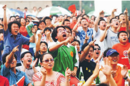
2002年6月4日,中国队第一次打入世界杯,在工体的外场球迷们观看中国队在世界杯的比赛。

1977年9月17日,张忠骑了近1个小时的自行车,从北京的南城一路骑到工体,只为能见到传说中的“球王”贝利。 他壮着胆子偷偷地下到跑道。“贝利离我最近的时候不到10米,就在场边练习,他那桑巴足球,看得我心怦怦直跳。”张忠一边说着,一边还抖动肩膀,模仿着贝利当时的动作。