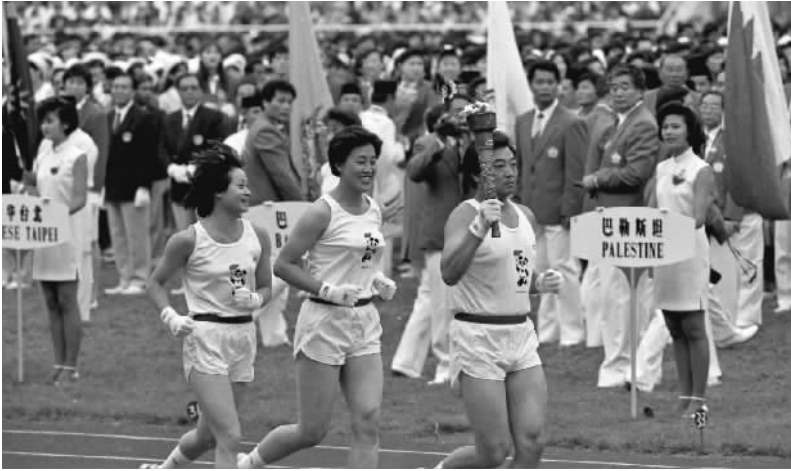
右图:1990年9月22日,北京工人体育场,第十一届亚运会开幕式,火炬手许海峰、张蓉芳、高敏(前排从右至左)跑入会场。

一座工人体育场,半部新中国体育史。 1959年,作为“首都工人阶级向新中国献礼工程”的北京工人体育场建成,成为新中国首个大型综合性体育场。这里见证了我国体育事业的飞速发展,也承载了几代人的情感记忆。 2023年4月,经过两年多的改造复建,新工人体育场完成了由综合性体育场向专业足球场的转变,在“传统外观、现代场馆”理念的指引下,工体以熟悉的样子重生归来。