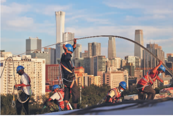
2022年7月18日傍晚,在北京工人体育场改造复建工程的顶棚上,工人们在太阳的余晖下作业。

4月1日,改造后的工体迎来首场大型职工群众性体育活动,1500名首都职工在这里跳起了工间操。