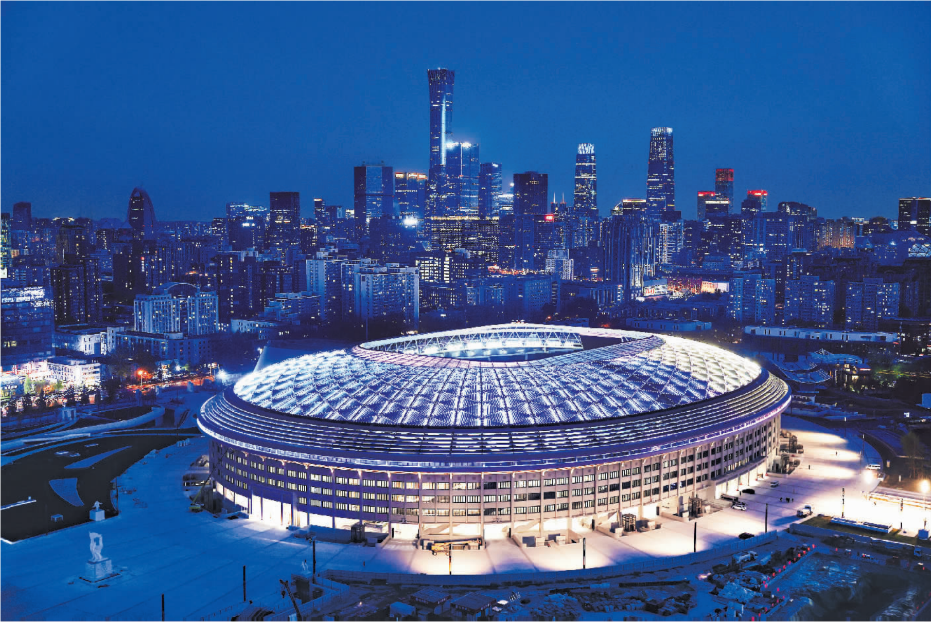
4月8日,北京新工人体育场进行亮灯测试,为正式投入使用做准备,不远处是灯火璀璨的北京CBD(中央商务区)。

“北京工人体育场的复建,其实是回归初心,不仅是回归工体建设的初心,也是回归中国体育的初心。”问及对新工人体育场的期许,张路认为关键要看将来工体及周边体育城市公园的运营,市民来到工体这片地方,“要有进行体育锻炼的地方,而不光是看运动员们竞技”。