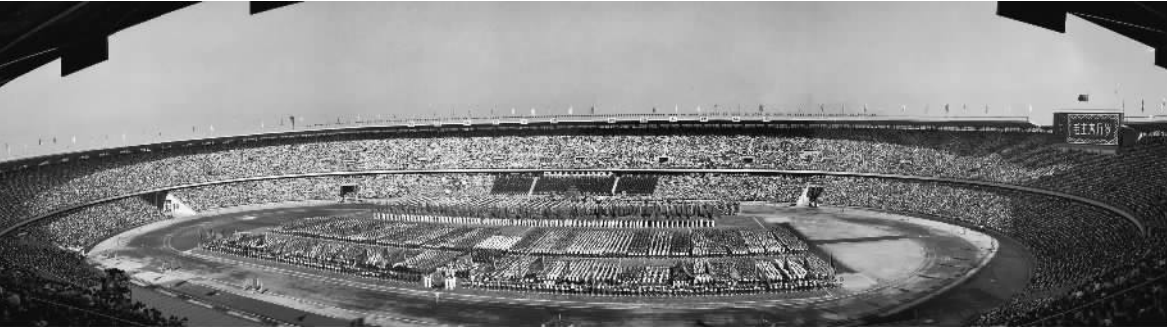
左图:1959年9月13日,第一届全国运动会在北京工人体育场隆重开幕。