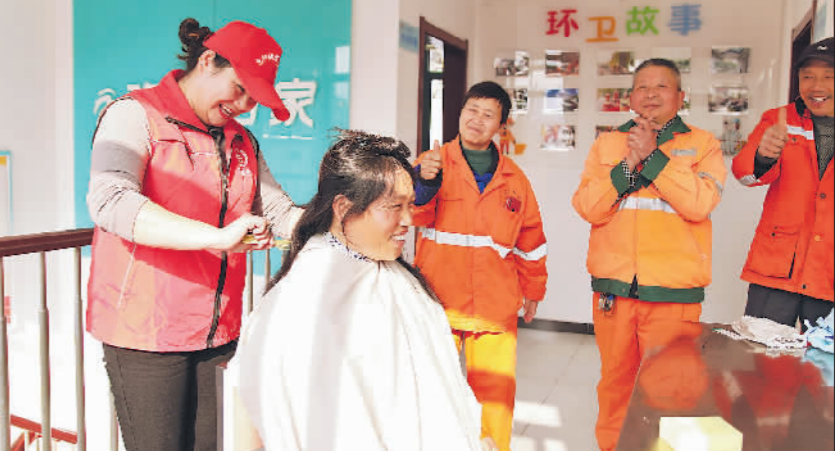
幸福驿站 免费理发

3月1日,安徽合肥包河区祁门路与呈坎路口的工会幸福驿站里,青年志愿者正在给环卫工人理发。包河区的一些工会幸福驿站由工会和环卫部门共同建设,为户外工作者提供休息纳凉、热水热饭等服务。