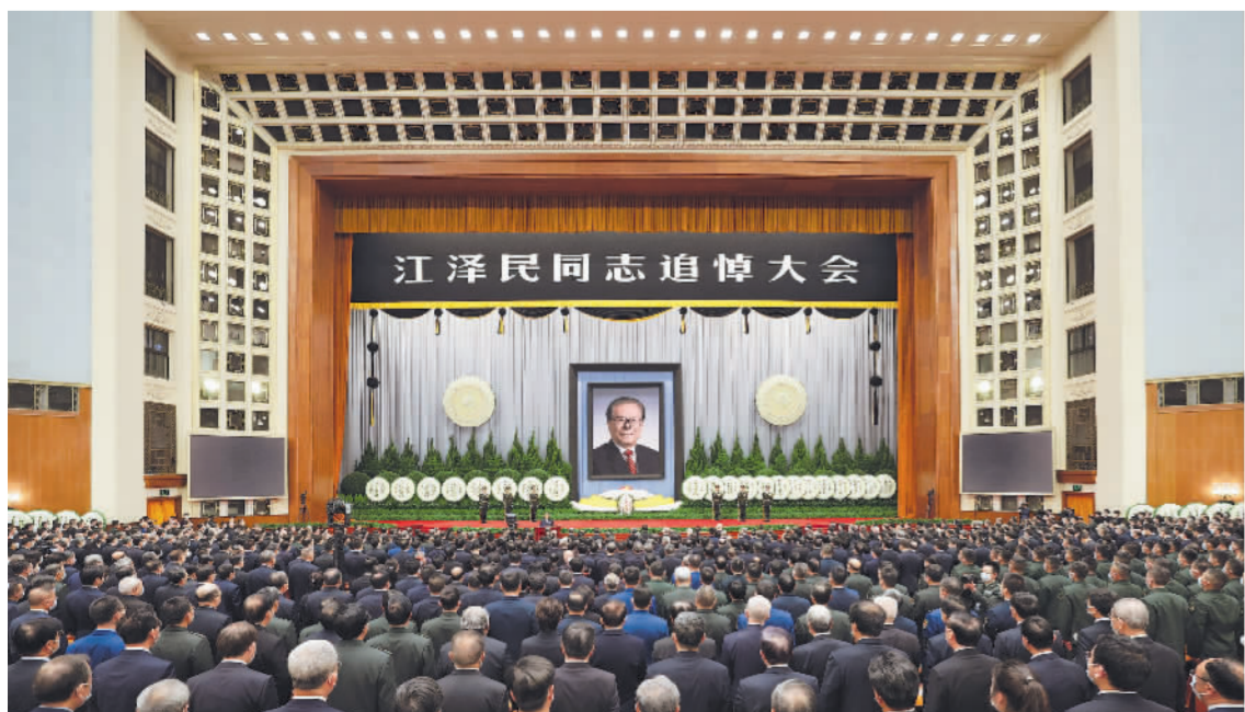
12月6日，中共中央、全国人大常委会、国务院、全国政协、中央军委在北京人民大会堂隆重举行江泽民同志追悼大会。新华社记者 丁海涛 摄