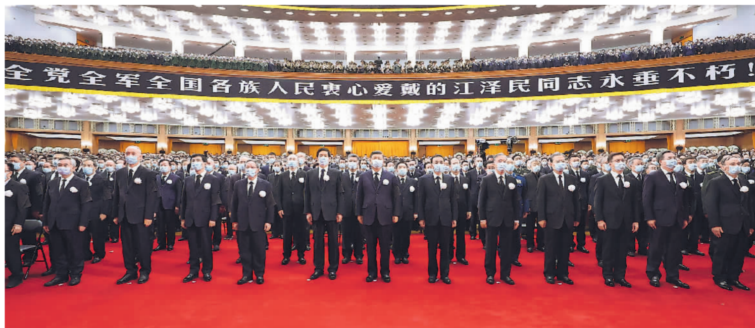
12月6日，中共中央、全国人大常委会、国务院、全国政协、中央军委在北京人民大会堂隆重举行江泽民同志追悼大会。习近平、李克强、栗战书、汪洋、李强、赵乐际、王沪宁、韩正、蔡奇、丁薛祥、李希、王岐山等参加大会。