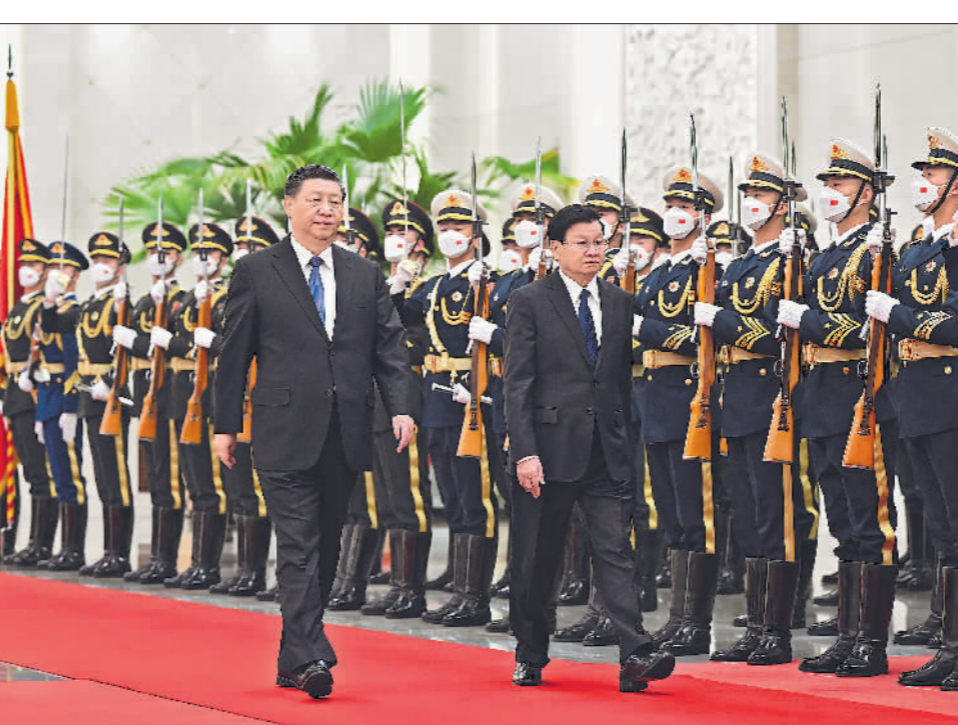
11月30日,中共中央总书记、国家主席习近平在北京人民大会堂同老挝人民革命党中央总书记、国家主席通伦举行会谈。

新华社北京11月30日电 11月30日,中共中央总书记、国家主席习近平在人民大会堂同老挝人民革命党中央总书记、国家主席通伦举行会谈。双方强调,要秉持“长期稳定、睦邻友好、彼此信赖、全面合作”方针和“好邻居、好朋友、好同志、好伙伴”精神,政治上互尊互信、经济上互惠互利、人文上相知相亲,不断深化中老命运共同体建设,为推动构建人类命运共同体作出积极努力和贡献。