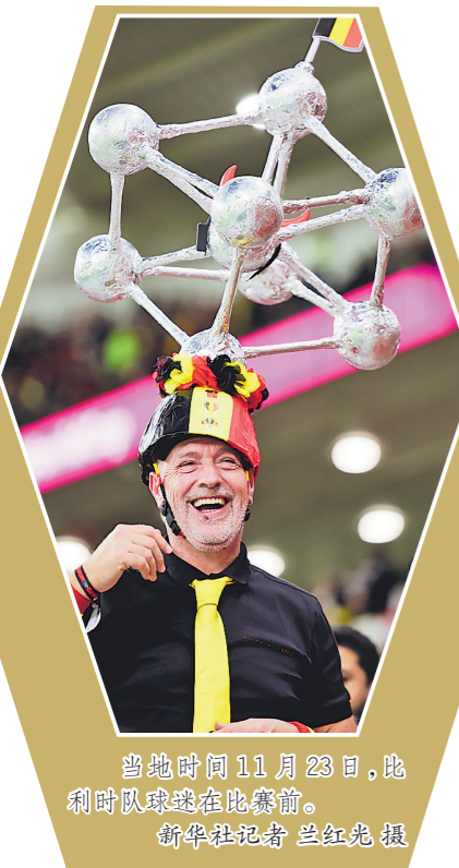
当地时间11月23日,比利时球迷在比赛前庆祝