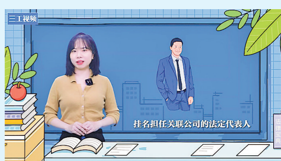
挂名担任关联公司的法定代表人

任职期间员工受公司委托,挂名担任关联公司的法定代表人。名头是响了,但隐患也埋下了。在这里提醒大家,如果被“挂名”或不慎陷入风险,一定要留存好相关证据,及时协商办理变更登记,通过法律途径积极救济,及时止损,避免“背锅”。