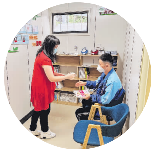
站内工作人员为外卖小哥递水。