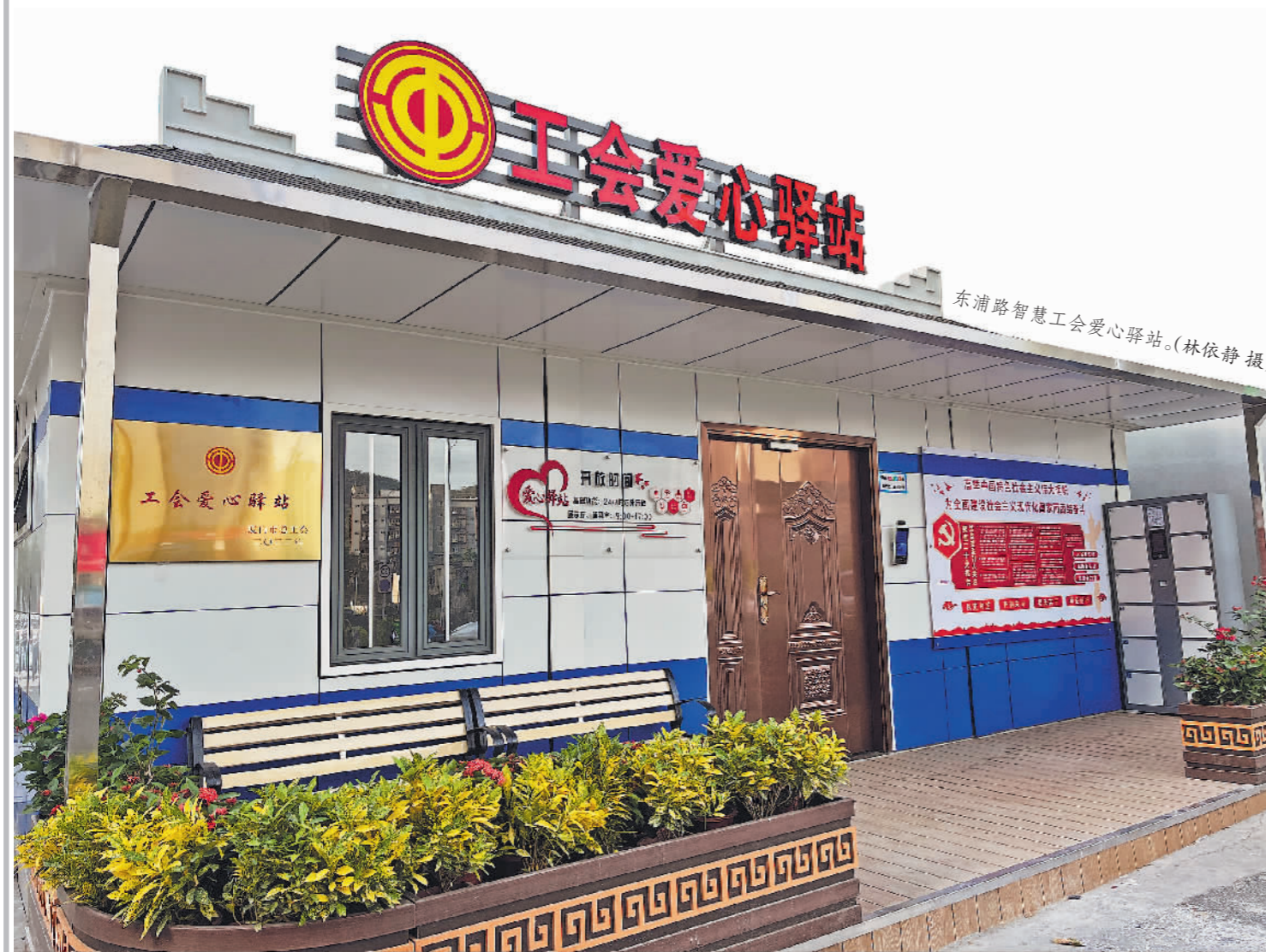
东浦路智慧工会爱心驿站。

下一步,厦门市总工会还将积极引入工会志愿者服务队伍,与驿站建设单位达成共建意向,形成以驿站为服务载体,志愿者定期驻站服务的“队站结合”新模式。驿站通过加载特色志愿服务,打破工会服务的局限性,不断充实驿站的服务内涵,进一步扩大工会爱心驿站的知晓率和社会影响力。(李剑婷 林依静)