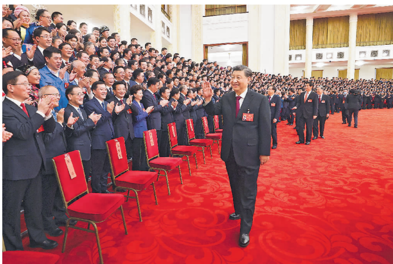
10月23日下午,中共中央总书记、国家主席、中央军委主席习近平等领导同志在北京人民大会堂亲切会见出席党的二十大代表、特邀代表和列席人员,同大家合影留念。