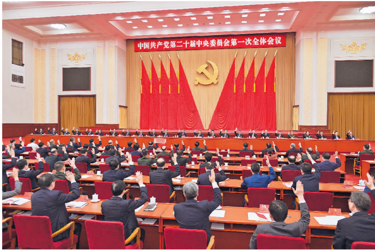
左图:10月23日,中国共产党第二十届中央委员会第一次全体会议在北京人民大会堂举行。习近平同志主持会议并在当选中共中央委员会总书记后作重要讲话。