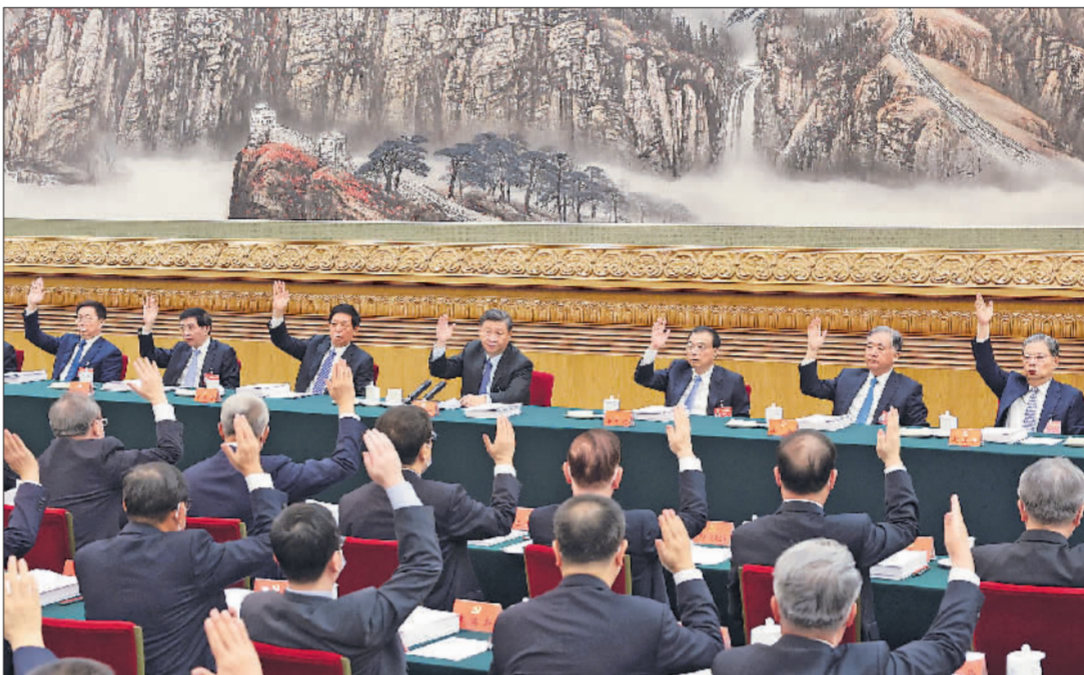
10月21日,中国共产党第二十次全国代表大会主席团在北京人民大会堂举行第三次会议。习近平、李克强、栗战书、汪洋、王沪宁、赵乐际、韩正等出席会议。

新华社北京10月21日电 中国共产党第二十次全国代表大会主席团21日上午在人民大会堂举行第三次会议,通过二十届中央委员会委员、候补委员和中央纪委检查委员会委员候选人名单(草案),提交各代表团酝酿。