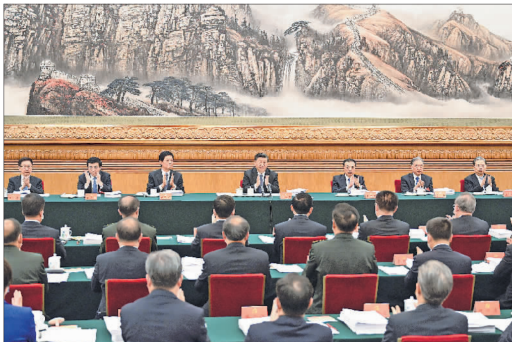
10月18日,中国共产党第二十次全国代表大会主席团在北京人民大会堂举行第二次会议。习近平、李克强、栗战书、汪洋、王沪宁、赵乐际、韩正等出席会议。

新华社北京10月18日电 中国共产党第二十次全国代表大会主席团18日下午在人民大会堂举行第二次会议。习近平同志主持会议。会议通过了将关于十九届中央委员会