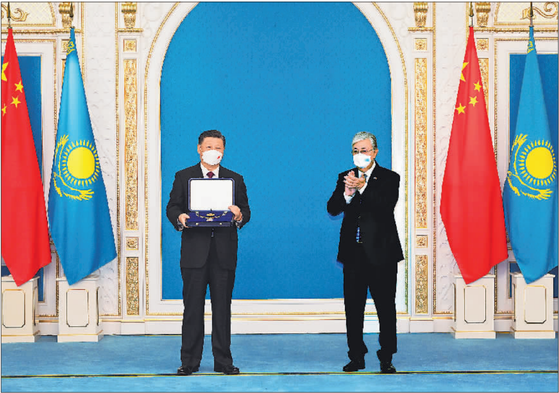
当地时间9月14日下午，国家主席习近平在努尔苏丹总统府接受哈萨克斯坦总统托卡耶夫授予“金鹰”勋章。

挥的历史性作用和作出的巨大贡献，表示习近平主席今天的访问必将载入哈中关系史册。哈方愿同中方一道努力，促进两国共同繁荣发展，增进两国人民福祉，携手迈向更加美好的未来。 托卡耶夫向习近平授予“金鹰”勋章。两国元首合影留念。 习近平致答辞。习近平指出，托卡耶夫总统向我授予“金鹰”勋章，体现了哈方对中哈关系的高度重视，以及哈萨克斯坦人民对中国人民的深厚情谊。 （下转第3版）